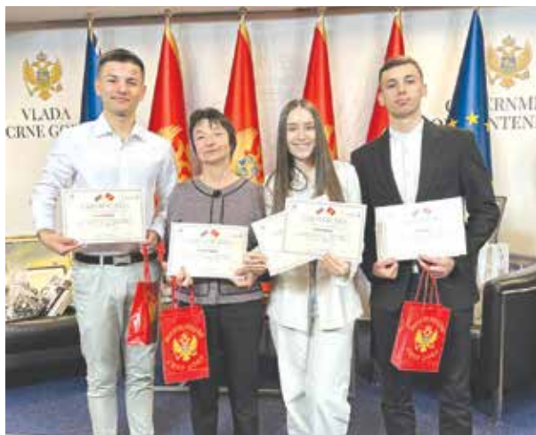
Айтоските младежи бяха избрани измежду 700 млади българи, заявили желание за участие в пилотната програма