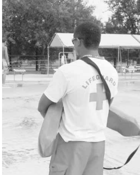
Заплатите на водните гардове на басейни и на море са еднакви

„Тази година се навършват 60 години откакто е създадена водноспасителната служба при БЧК. 60 години те обучават спасители – през тях са минали над 10 – 15 хиляди спасители за басейни и море. Другите не знам дали ще имат това високо ниво на обучение. Ние имаме световни и европейски шампиони по водно спасяване. България е една от петте сили по водно спасяване в света. Под въпрос са нещата. Но трябва да се даде шанс.