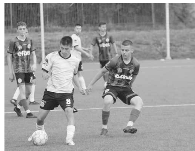
„Зелените“ надиграха „Бургас спорт“ с 4:0

В началото на второто полувреме Кръстев вкара последния гол в срещата.