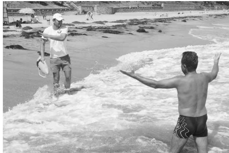
Отговорността на спасителя на море е далеч по-голяма от тази на колегата му на басейн