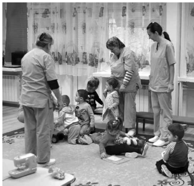
Всеки курс за помощник-възпитател завършва с полагане на изпити по теория и практика

Цената на самите курсове тръгва от 200 – 300 лева и стига до над 1200 – 1400 лева. Като по негови думи има значение дали един курсист вече работи като помощник-възпитател, или не. Ако от друга професия има желание лицето да се преквалифицира