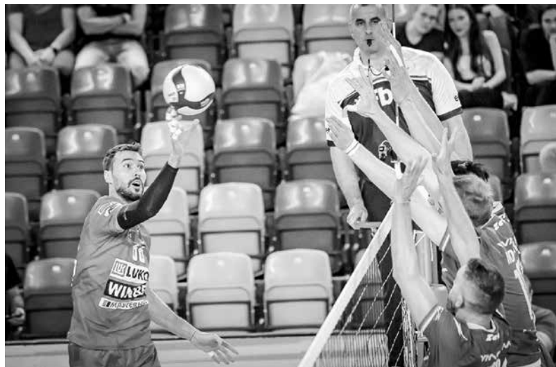
„Дея спорт“ е на крачка от финала

тоев и Лукас Мадалоз с по 19 точки. Николай Учиков записа 14.