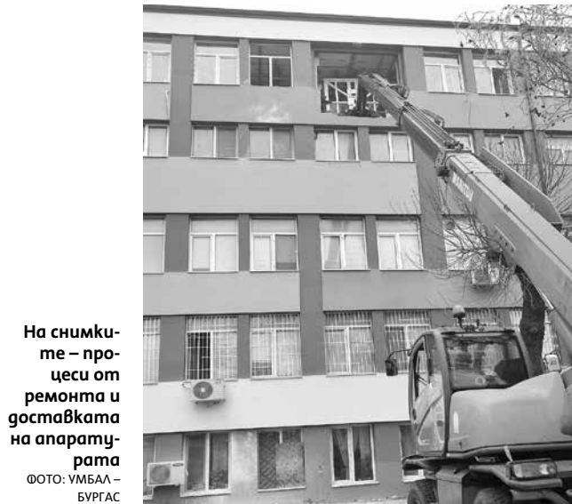
На снимките – процеси от ремонта и доставката на апаратурата

Апаратурата съчетава последните виждания за бъдещето на инвазивната кардиология в помощ на най-добрите и съвременни методи за лечение на заболявания като исхемична болест на сърцето, клапни заболявания, периферна артериална болест (вкл. каротидни, бъбречни артерии и др.). Благодарение на ясният образ кардиолозите могат да вземат решение в реално време, да прилагат иновативни и цялостни подходи. Едно от най-големите предимства на апарата са по-ниските дози на облъч-