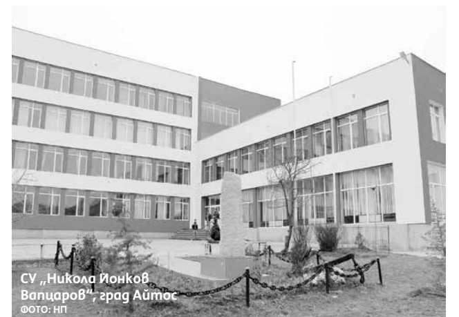
СУ „Никола Йонков Валцаров“, град Айтос