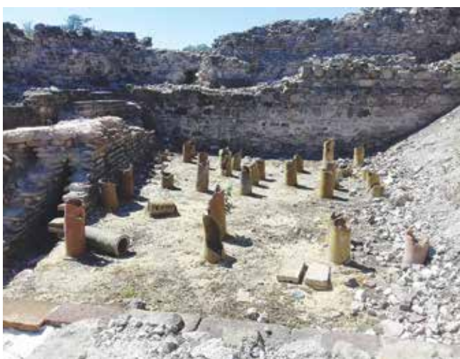
Деултум очаква своите гости