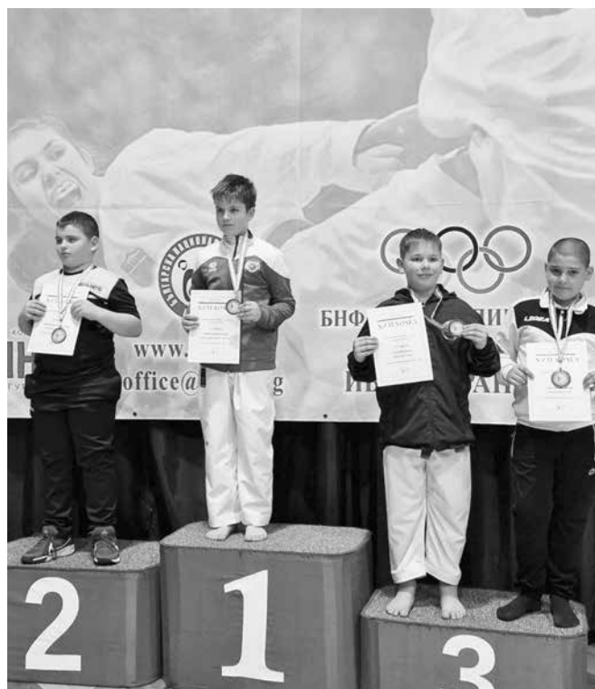
Бургас бе представен от състезателите на Карате клуб „Сансай“

Бургас бе представен от състезателите на Карате клуб „Сансай“, които завоюваха 3 златни и 7 бронзови медала във всички възрастови групи.