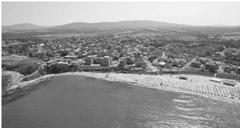
Панорамен изглед на Лозенец днес

Мнозинството от тях са от село Велика в турска Странджа, днес село Балабан. Прогонени от турската войска след Втората балканска война, наричана още Междусъюзническа, на 20 септември 1913 г., бежанците усядат първоначално в с. Потурнак, тогава турски чифлик. Към тях се присъединяват и групи техни сънародници, главно от град Малък Самоков (днес Демирхюьк в Турция). В началото на 20-те години обаче в Европа се разпространява епидемия от т.нар. испанска болест, която взема милиони жертви и причинява много смърт и в Потурнак. По совет на лекари, за да избягат на по-пробито място, част от селяните се насочват към изоставеното от много