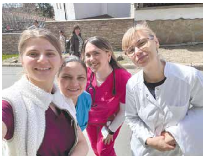
Екипът, който проведе Седмицата на здравето в селата

Първата профилактична кампания на общинската болница приключи успешно – резултатите показаха изключителен интерес на хората в малките населени места към предоставената им възможност да проверят кръвното налягане и да се консултират с лекар за здравните си проблеми. „Освен насоки за поддържане и контрол