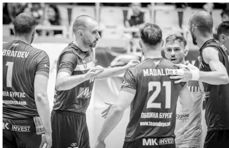
„Нефтохимик“ ще играе на живот и смърт тази събота, за да запази шанс за финала

Най-резултатни за бургазлии бяха Валентин Бра-