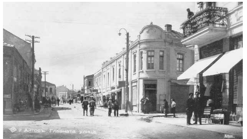
20-те години на XX век – Айтос, Главната улица

им казваше „убийци, това няма да ви сразмине, рано или късно ще си получите възмездие“.