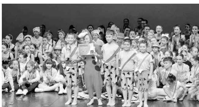
Журито и публиката впечатлени от талантиливите танцьори на айтоската школа