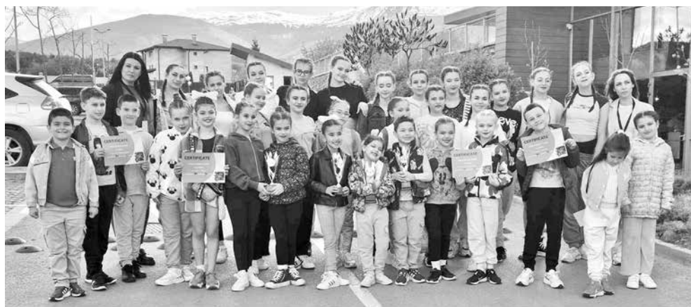
С медалите и купите след големия успех

Четири квоти за Световното първенство по танци Dance World Cup в Прага 2024 получи от строгите съдии айтоската танцова школа. И това не е първият успех на Школа – още преди девет години „Тиара“ имаше първата си блестяща изява на световния дансинг.