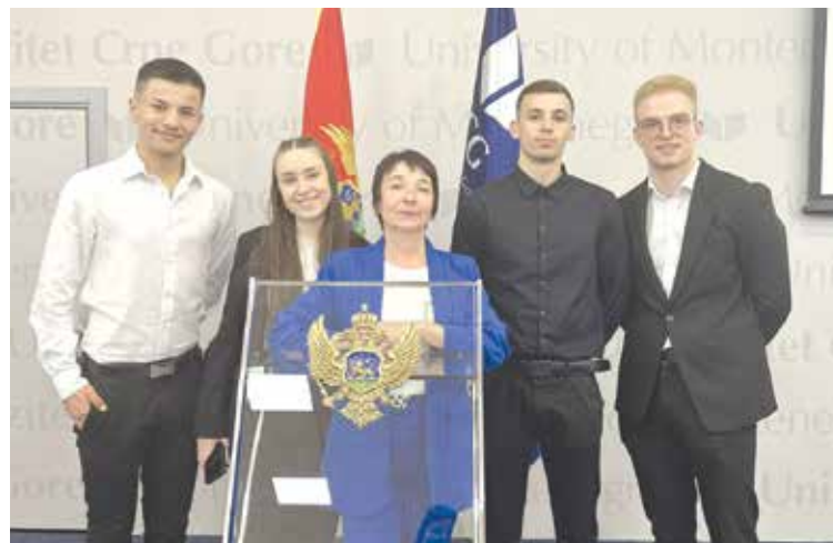
В Университета на Черна гора