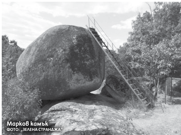
Марков камък

Големият камък или по-известен като Марков камък край Долно Ябълково, е древно култово съоръжение. Обектът е описан и често като „Тракийско светилище Големият камък“. Камъкът представлява мегалитен валун с височина 8 метра, който е закрепен върху две други скали, така че под него се образува процеп. На върха на скалата в древни времена са издълбани две продълговати жертвени ямки с формата на стъпки, които според народните