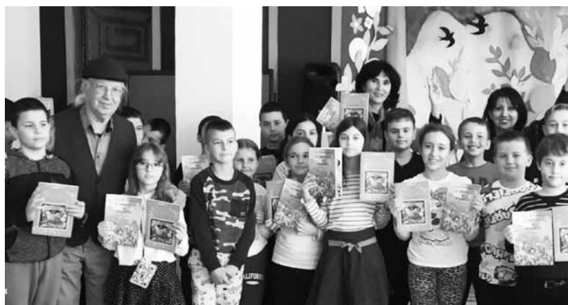
В СУ „Димчо Дебелянов“, Бургас се проведе традиционните конкурси