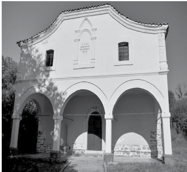
132-годишната църква в селото