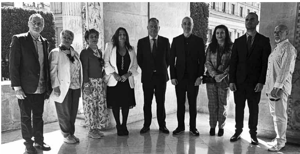
Среща с кмета на гр. Севиля – Хосе Луис Санс Руиз