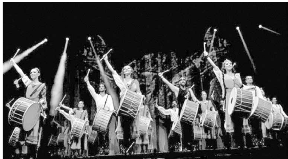
Рекордъорите на Гинес „Огънят на Анадола“ ще смят публиката