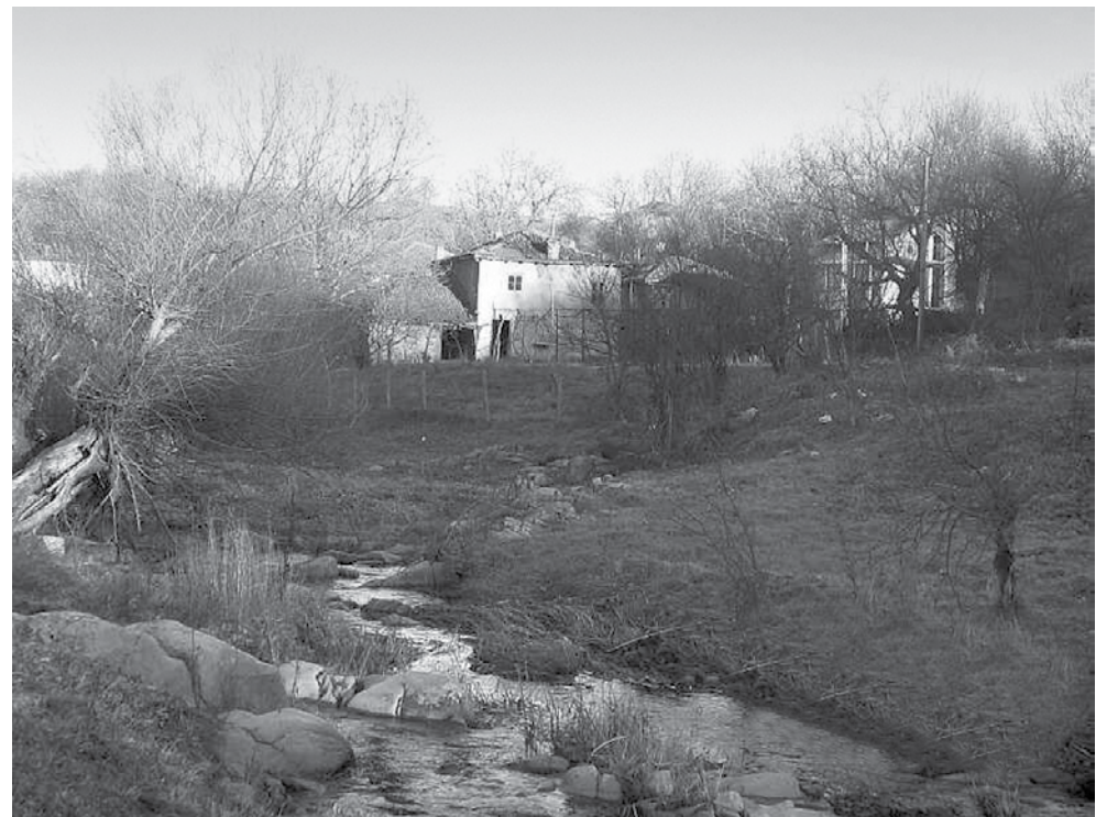
Красива гледка от селото

Запитана за това, защо се организира концертът