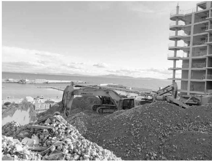
Така изглежда в момента районът

Реконструкцията, която се извършва към момента по съоръжението, ще доведе до разширяване на бул. „П. К. Яворов“, в частта, минаваща покрай интерхотел „Поморие“. Предвидено е в конкретен