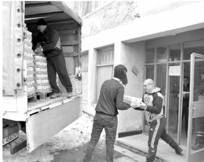
Пред пункта на ул. „Паркова“

Пакетите с храна са предназначени за лица и