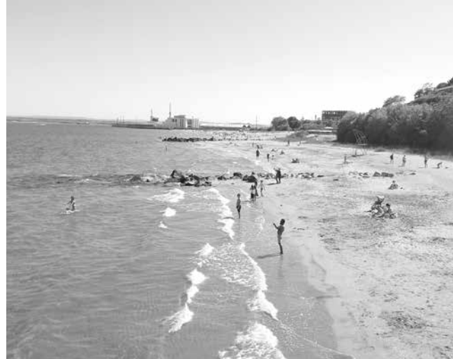
Бургазлии обичат да ходят на плаж след края на работния ден

Би било добре, ако независимо от това кой обучава – изпитът накрая да се провежда от БЧК“, казва Русев.