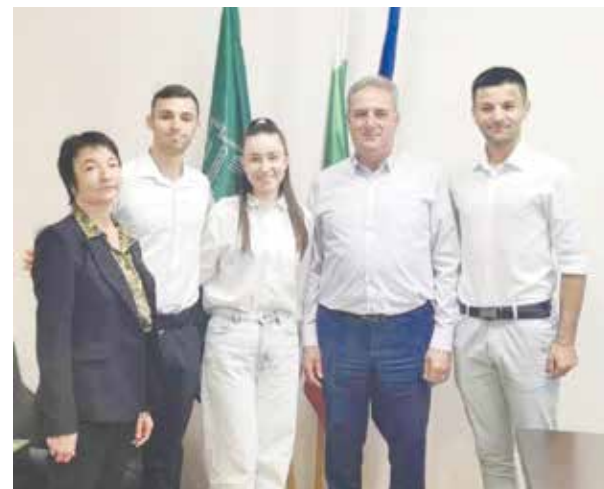
С благодарност за съдействието на Община Айтос