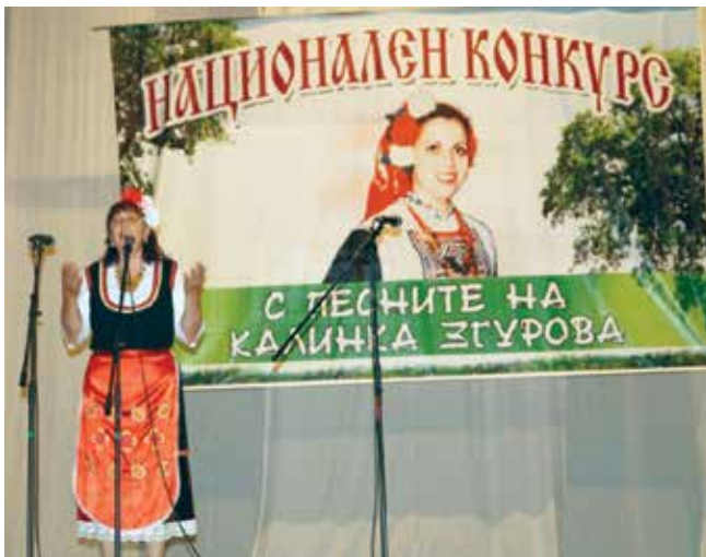
Село Дебелт за първа година домакинства конкурса „С песните на Калинка Згурова“

гр. Калинка Згурова е и сред малкото български изпълнители, отличени със световната музикална награда „Грами“. В Златния фонд на БНР и фонотеките на регионалните му станции певицата има над 300 самостоятелни песни и участия в дуетни, камерни и хорови песни.