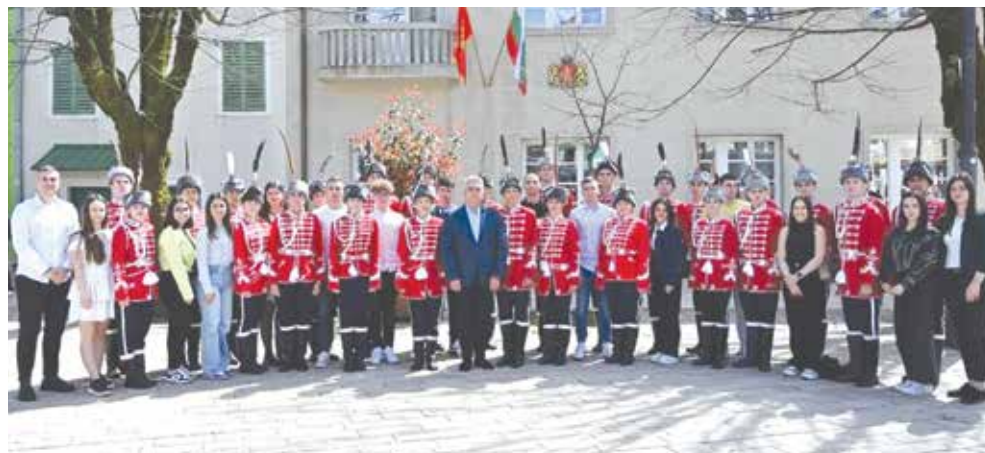
Българската група в Черна гора