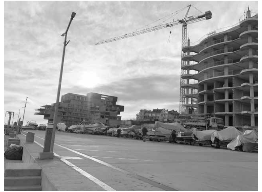
Частният инвеститор придоби преди време собствеността върху имота

шест докладни за продажба на общински терени. Всички, освен една, са поискани на кметове по населени места. Направи ми впечатление, че БСП гласуваха против – принципно – и по шестте точки. Остава част от опозицията се противопостави на три от докладните. Не гласува „против“ в населените места – Лъка, Александрово и Горица. Буди интерес перспективата кои ще излязат на търга в