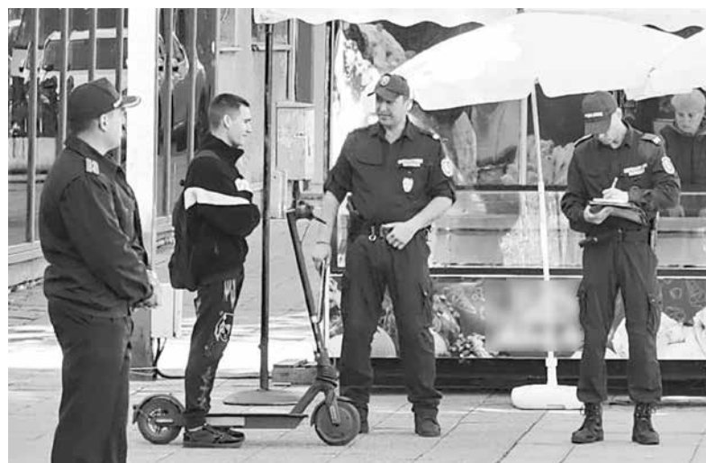
Полицията тези дни извърши нова акция, в която 51 души получиха актове и фишове

Друго интересно предложение е да се изисква задължително от клиентите потвърждаване на възрастта, като операторите въведат допълнително изискване потребителите да сканират или снимат документите си за самоличност.