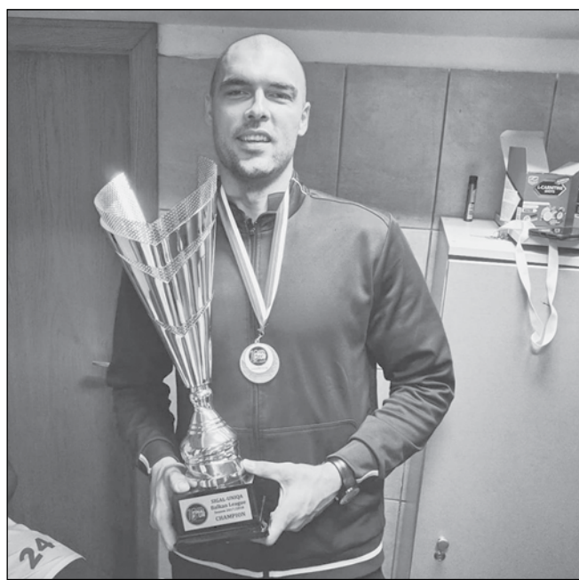
Бургазлията с един от многото си трофеи - този на Балканската лига, докато бе част от отбора на „Левски Лукойл“

Никога няма да забравя усещането от играта