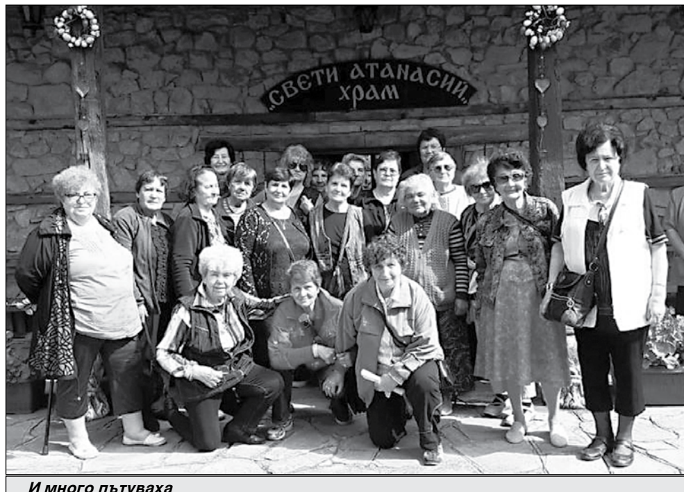
И много пътуваха