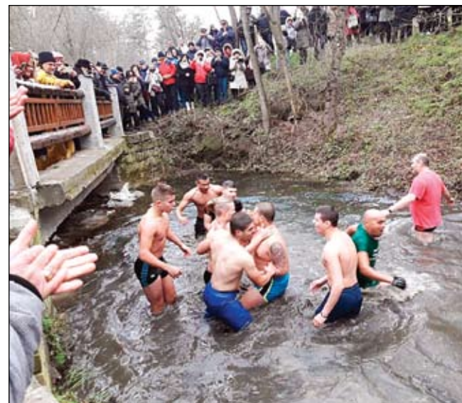
Гвардейците поведоха хорото