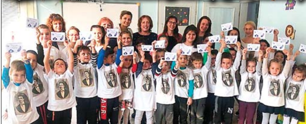
Учителите на СУ „Никола Вапцаров“ с младите възрожденци на ДГ „Здравец“

Гордеем се с Вас и с нашата детска градина, казват учителите ветерани