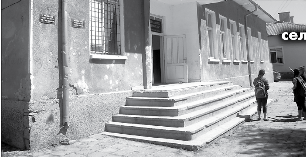
Читалището в с. Мъглен

Единствената културна институция в селото не е ремонтирана от десетилетия