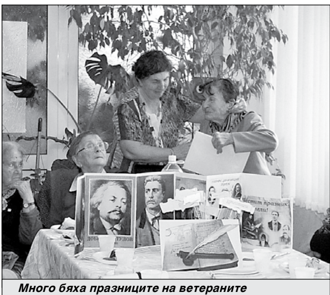
Много бяха празниците на ветераните

Клубът на учителите ветерани „Вяра” - Айтос изпрати с емоционално парти една успешна година. За пореден път учителите на няколко по-