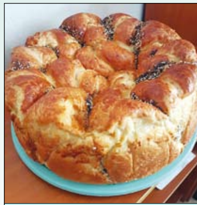
Не само красива, но и много вкусна

но и много вкусни питки. И всичко това тя прави безвъзмездно, с наричане за здраве и късмет на хора-