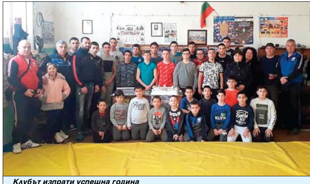
Клубът изпрати успешна година

тен балкански шампион на Балканиадата в Панагюрище. Айтозлията е студент втори курс в НСА и вече е в състава на мъжкия национален отбор по борба. Голямата му цел през тази година е участието в Европейското първенство за младежи до 23 години през лятото в Залцбург, Австрия.