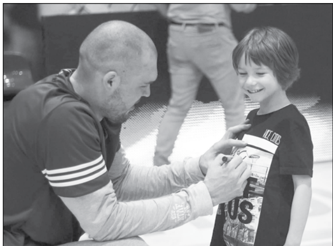
Гларуса дава подпис на свой фен в Полша

- Здраве за мен и моето семейство. Това е най-важното, всичко друго е преходно.