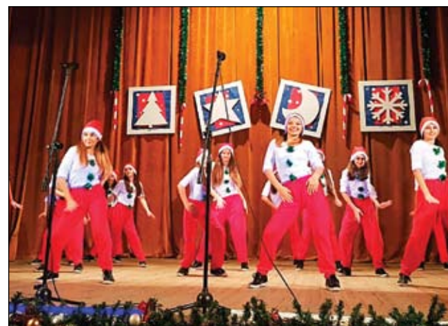
В края на месец декември 2019 година, в един ден, НЧ „Васил Левски 1869“ и Военният клуб изпратиха старата година с емоционални новогодишни концерти. Във Военния клуб Акробалет „Тиара“ събра своята публика, а в салона на НЧ „Васил Левски 1869“ айтозлии аплодираха празничната изява на художествените състави на Читалището.