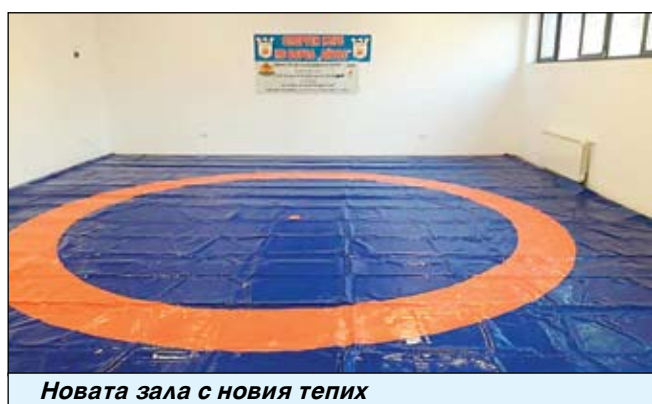
Новата зала с новия тепих

Докато очакват да се настанят в чисто новата си тренировъчна зала в Спортна зала „Аетос“, борците на КСБ „Айтос“ нон-стоп тренират във физкультурния салон на бившето ОУ „Любен Каравелов“. Програмата им за участие в държавните състезания тази година започва още през този уикенд. На 11 и 12 януари е шампионатът на юношите в Сливен. Отсега усилените тренировки водят и момчетата, които ще се борят за медали и