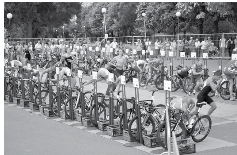
От 7:00 часа днес, до 15:00 в неделя, улица „Поморийска“ и паркинг „Капани“ в Приморски парк ще бъдат затворени за движение и паркиране на автомобили

През лятото на 1995 г. Илиев преминава в португалския гранд „Бенфика“. Оставам два сезона, в които записва общо 51 мача с 4 гола – 40 мача с 4 гола в Примейра Лига, 7 мача за Купата на Португалия и 4 мача в КНК. С „Бенфика“ печели Купата на страната през 1995/96.