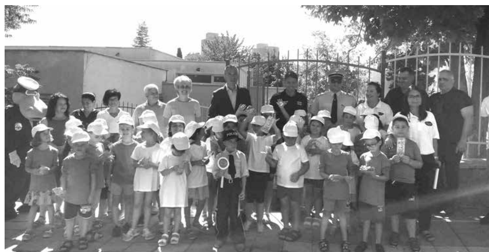
След открития урок – снимка за спомен с гостите