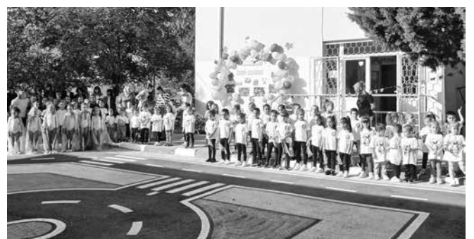
Община Айтос се е погрижила всяка детска градина да има площадка по БДП, на която се провеждат практически занятия с децата от всички групи

седател на Държавна агенция „Безопасност на движението по пътищата“. Според Крумова, инициативите по БДП трябва да достигнат до възможно най-голям брой деца, учители, възпитатели и родители; илюстрирана книжка за оцветяване с образователно съдържание. Книжката е достъпна безплатно за сваляне от интернет страницата на Агенцията: https://www.sars.gov.bg/obuchenie/ образователно видео, което да насочи вниманието на родителите върху личния пример и как да учат децата да пресичат безопасно – достъпно на страницата на ДАБДП, в