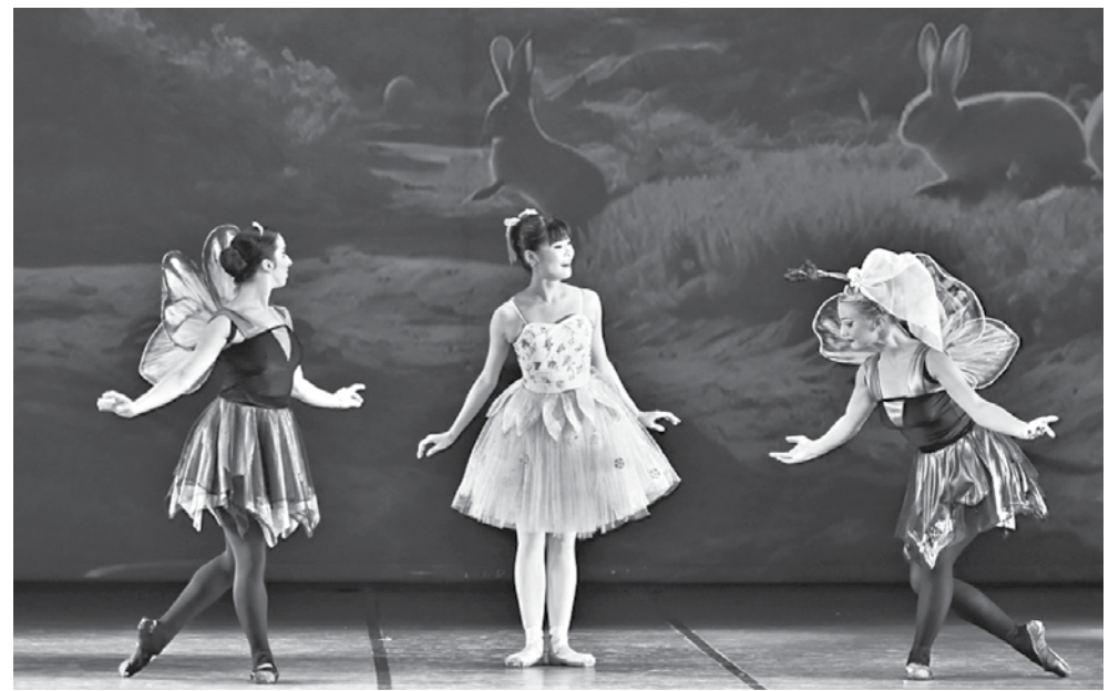
Впечатляваща е сценографията на постановката „Палечка“ на Държавна опера Бургас – по формата на 3D мапинг