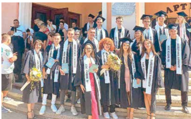
Вапцаровци не се питат: А сега, накъде? Всеки е избрал пътя си