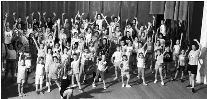
Лятна академия 2023

Община Айтос Общинска администрация СЪОБЩЕНИЕ