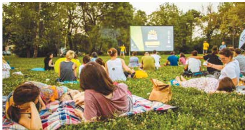
Киносалонът на открито ще е в село Кондолово