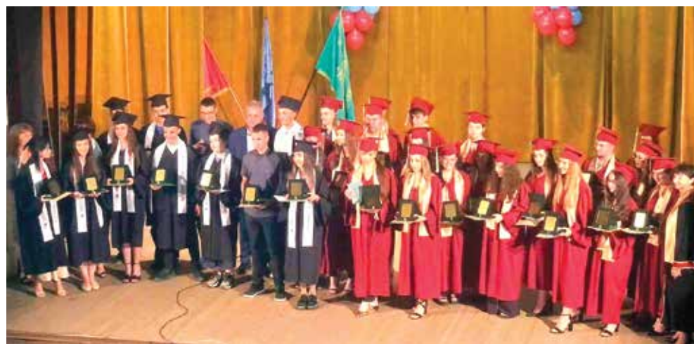
Отличниците на Випуск 2024