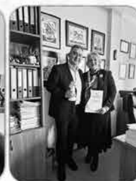
Договор за съвместно сътрудничество между ПГМКР "Свети Никола" и Бургаски свободен университет