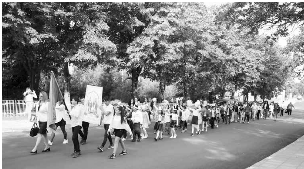
Празничното шествие на 24 май в село Бата