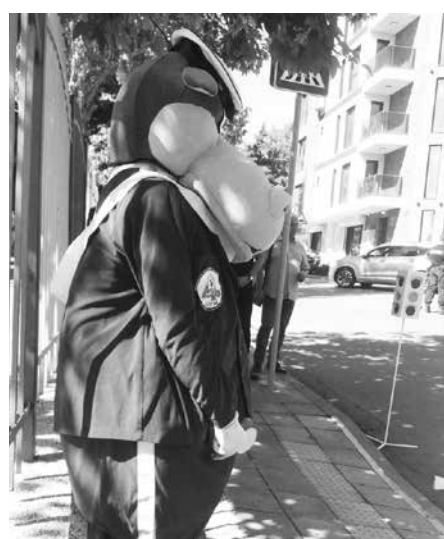
Деца отговаряха на въпроси под зоркия поглед на техния любимец инспектор Хитами