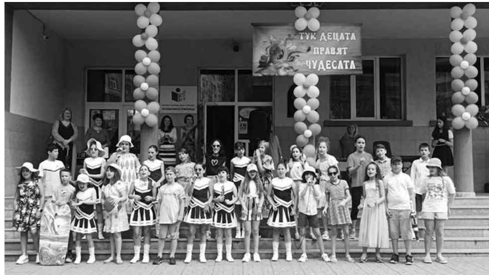
В края на учебната година в ОУ „Васил Априлов“ се поздравиха с отличните резултати, постигнати на НВО в IV клас