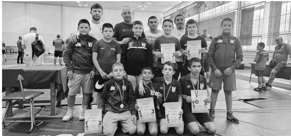
Отборът на СКБ „Айтос“

СКБ „Айтос“ успя да впечатли съдиите и публиката на Първия национален турнир с два