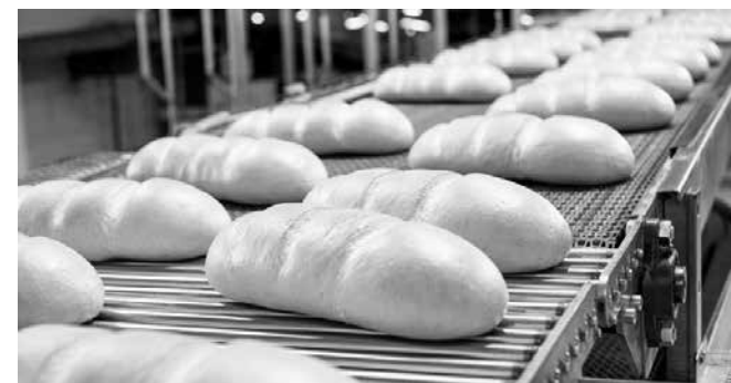
Белият хляб е сред най-консумираните у нас