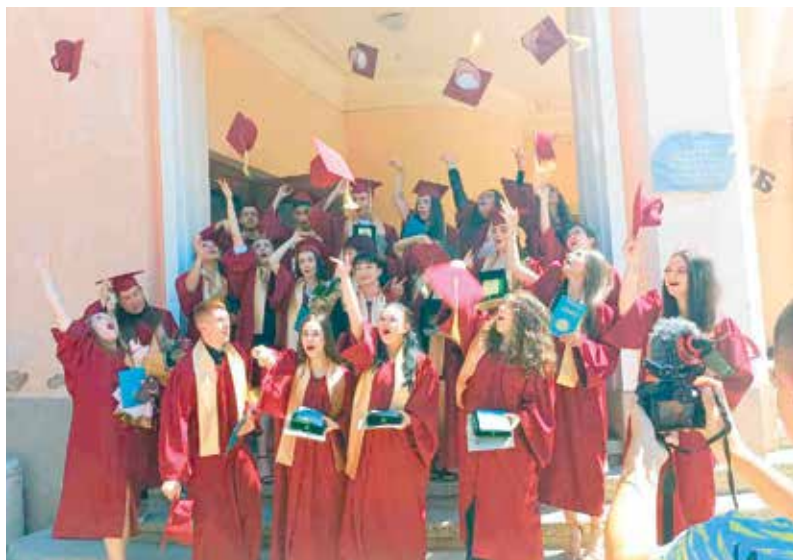
БОТЕВЦИ С ДИПЛОМИ