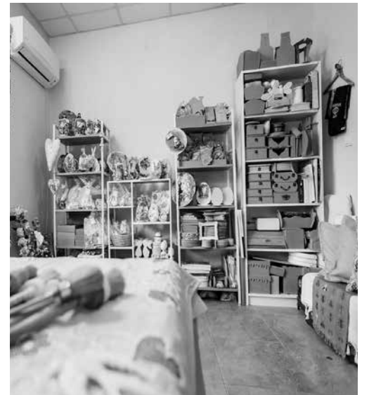
Още от работилничката, има и лятна стая за игри