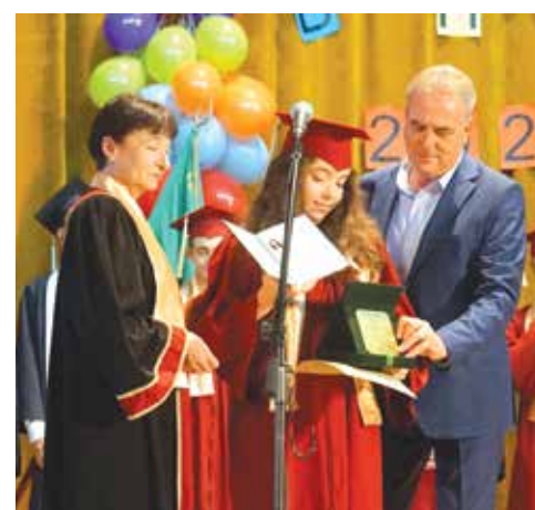
Глория с пълна шестца и почетен плакет от кмета Егрев