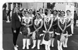
Мажоретен състав "Морски сирени"