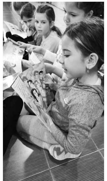
В библиотеката на НЧ „Васил Левски 1869“ – Айтос

За повече информация тел. 0879168013 – Цветелина Драгеева