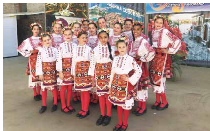
Фолклорен танцов състав „Шарено гайтанче“