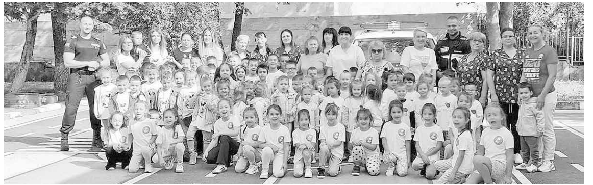
Полицейските служители получиха горещи обещания от новите си малки приятели