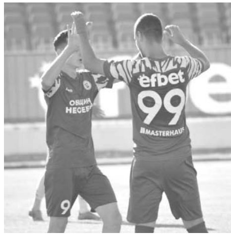
„Несебър“ може да играе със „Септември“ на 1/16 финалите

При победа, „Черноморец“ ще се срещне с „Локомотив“ (Пловдив) на 1/16 финалите, а „Несебър“ ще приеме „Септември“ (София).