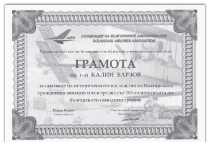
Грамота от Асоциацията на българските авиокомпани (АВА) за значителен принос за опазване на историческото наследство на Българската гражданска авиация и във връзка със 100 години на българското самолетостроене. Б.м. 2015 г.