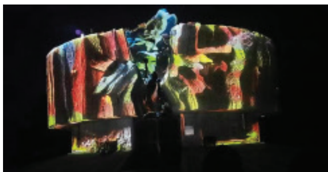
Артистите показаха как може да се преобрази той. За младите вече ще има нов смисъл, а не само исторически

Той представя творби от български и международни автори, в разнообразни артистични жанрове: танц и театър, инсталация, звуков дизайн, видео арт и др.