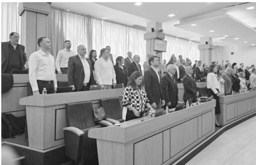
Съветници от повечето групи подкрепиха революционното решение

Най-вече градоначалникът увери всички граждани, които имат притесненията относно „Краснодар“,