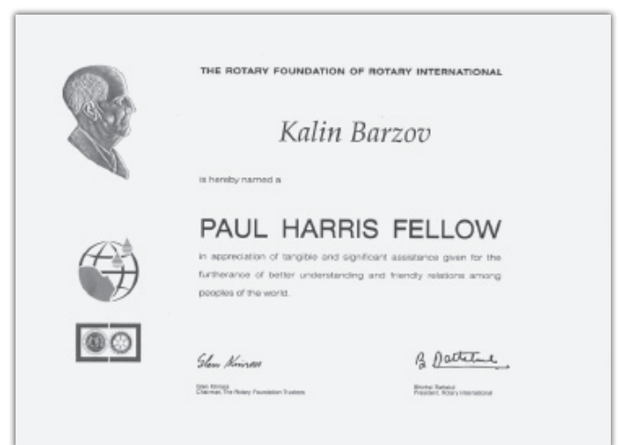
Удостоверение за връчване награда за принос „Пол Харис“. 1996 г.