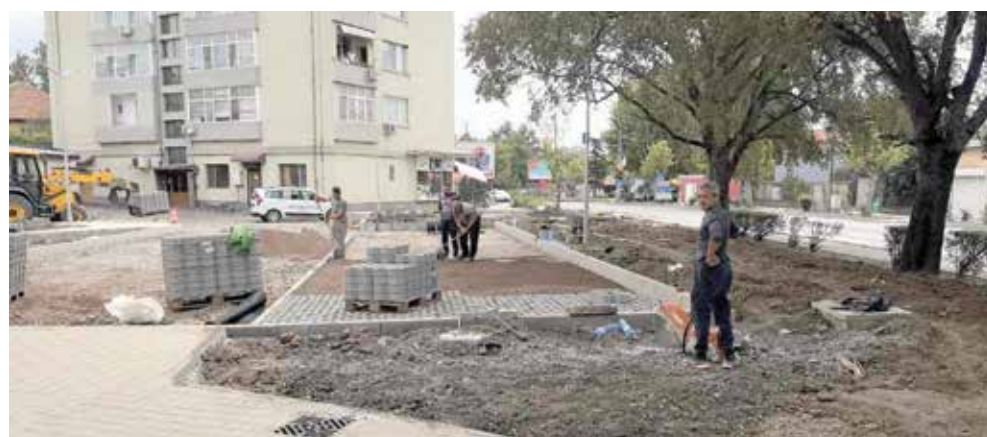
Настилка за паркоместата