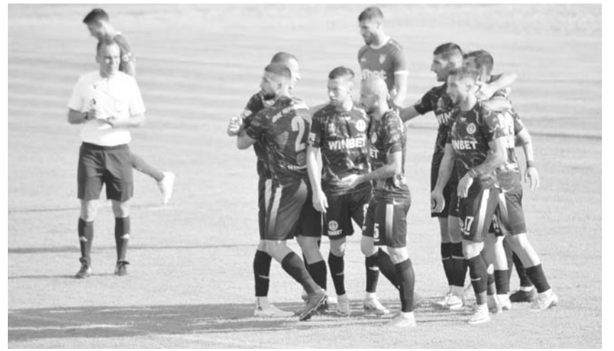
Бургазлии ще имат нелеката задача да преминат през „Етър“