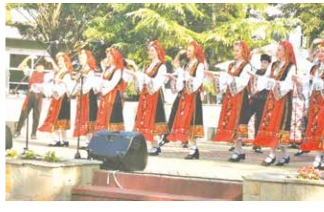
ПФА „Странджа“ – град Бургас на откритата сцена на площад „Свобода“