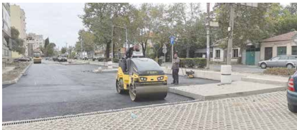
Довършителни дейности покрай ул. „Славянска“