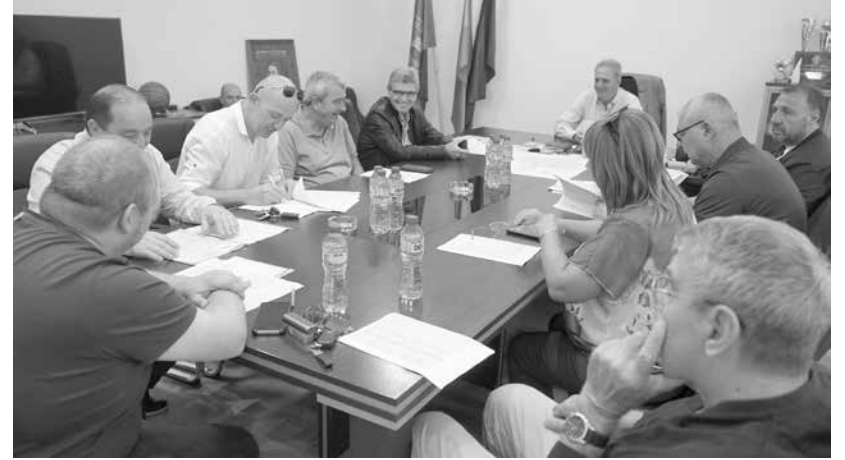
Усмивки и добро настроение на консултациите за СИК

ха добрия тон, нямаше спорове и претенции. Всички подписаха протокола от консултациите без особено мнение. И двете страни, представени като ДПС, изпратиха до местната изборна администрация списъци с 51 имена за ръководни постове и членове на СИК. Дали и как точно ще бъдат разпределени между двете фракции – казуса ще решава Районната изборителна комисия (РИК) – Бургас. НП