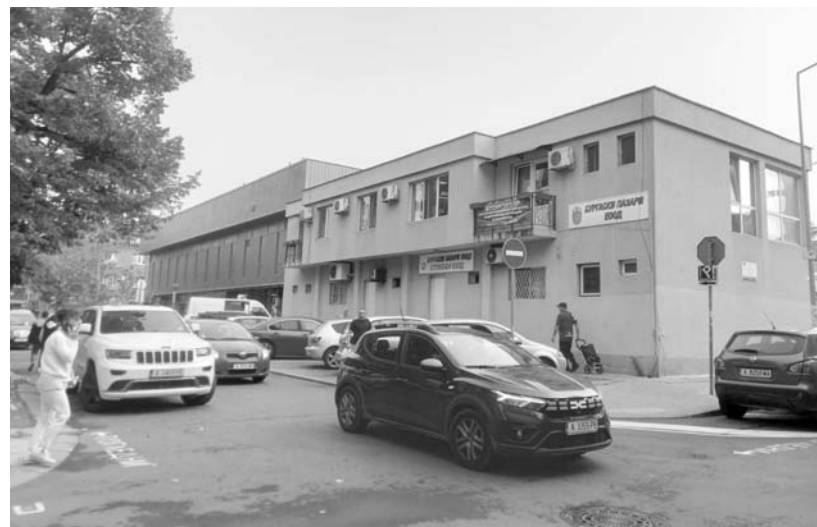
В момента изобщо не се обмисля изграждане на паркинг на пазара „Краснодар“, въпреки че бе най-желаното място

След прогължилите дебати по темата, докладната бе приета.