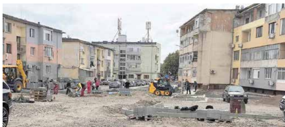
Квартал 49 е строителна площадка