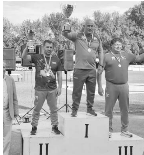
Турнирът е традиционен и включи 15 клуба и 91 състезатели