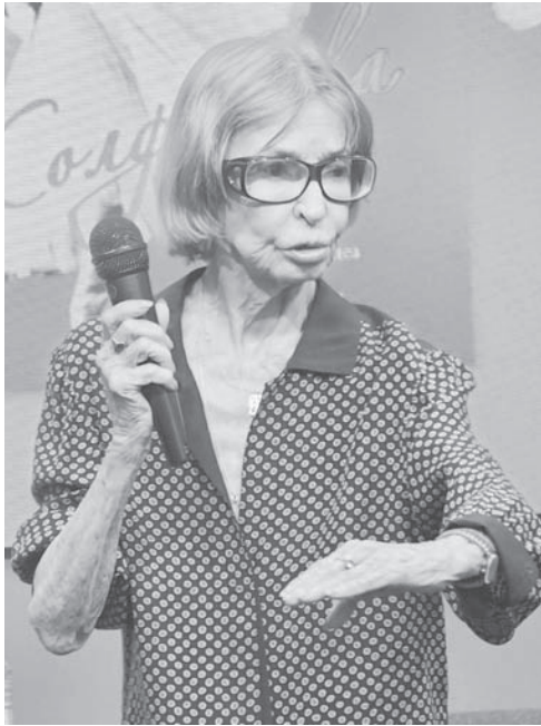
85-годишната балерина енергично и с ентузиазъм увлече публиката с историята си