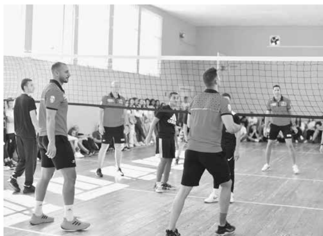
Да играеш го звездите!

от клубната делегация. Преподаватели и ученици благодариха на „нефтохимиците“ за гостуването в СУ „Христо Ботев“, с признанието: „В наше лице имате верни фенове!“ и с пожеланието за успешен сезон.