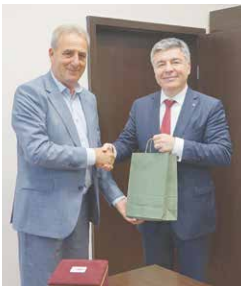
Кмет и Генерален консул си размениха символични подаръци