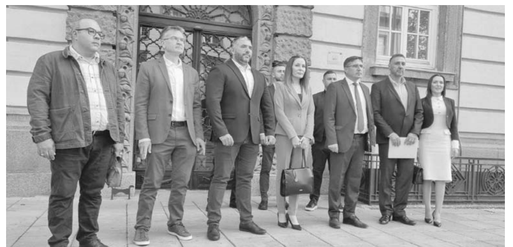
„ДПС Ново начало“ пристигнаха за регистрацията със силен отбор