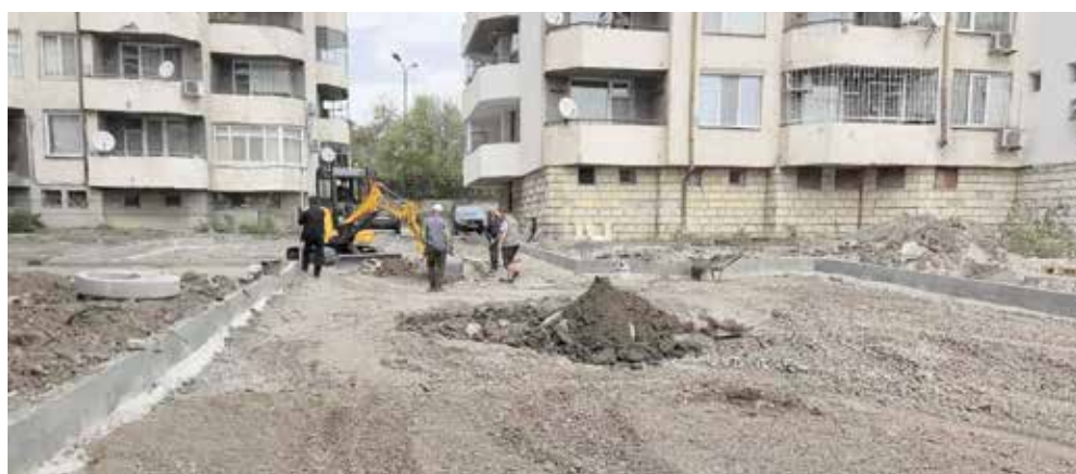
Машините са на терен