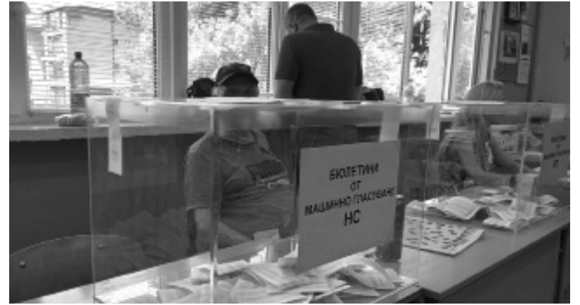
Ще успеят ли партиите да амбицират избирателя да излезе да урните за 7 пореден път е основният въпрос

Като цяло голяма част от листите са редени на принципа на съставянето на футболни отбори-имаи резултати, влизаш в играта, или показал си личен вот – предпочетен си. Дали това обаче ще се окаже ефективно предстои да стане ясно на 27 октомври вечерта.