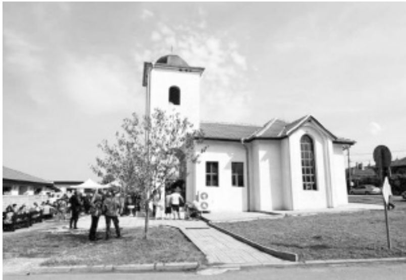
Така изглежда отвън новата църква в Средец

Ден по-рано на тържествено заседание на Общинския съвет по повод празника на Средец имотът, върху който е разположен