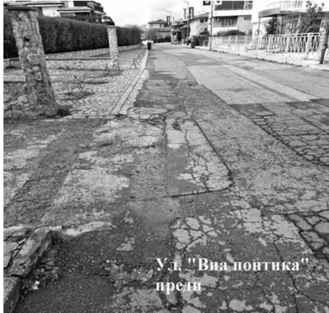
Ул. „Виа понтика“ преди

За сезон 2024 се пусна в експлоатация система за разплащането на фишове за неправилно спиране и паркиране със софтуер, който е в онлайн връзка