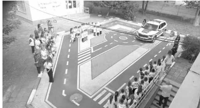
И полицейска кола в двора на детската градина