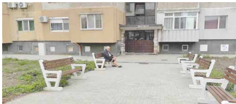
В квартал „Васил Априлов“