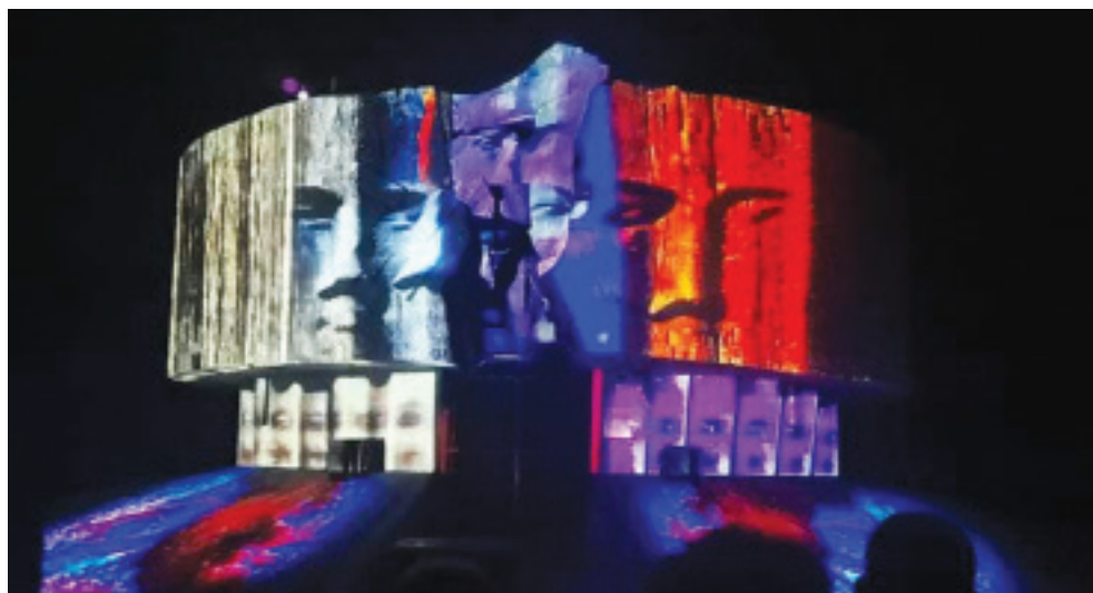
Различни асоциации предизвика светлинното шоу на паметника, който е един от ключовите в Бургас