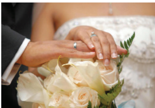
Все повече са двойките, които избират дати с повтарящи се цифри

предложения на млади украинки, които предпочитат любов извън родината си. Някои не горят от желание за брак, други пък им омръзва да са съпруги и се развеждат бързо. Разбира се, има и бракове „докато смъртта ни раздели“.