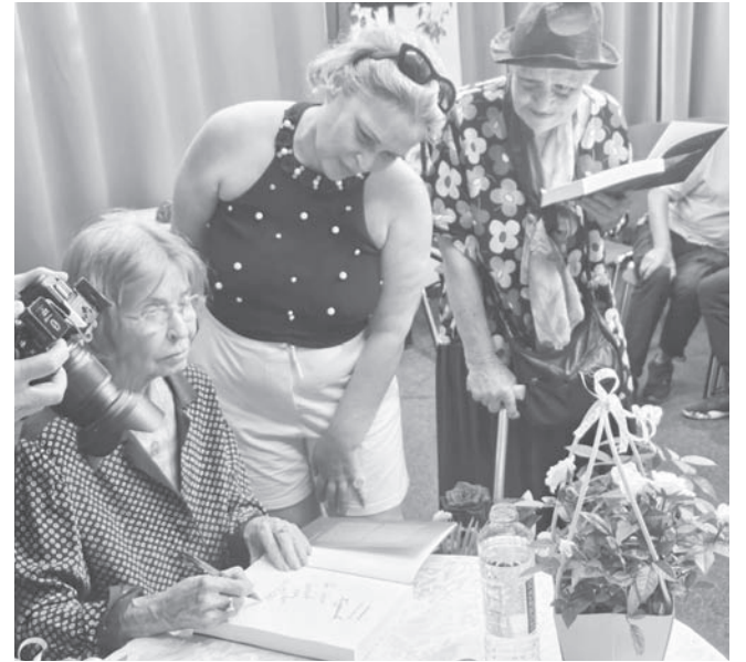
Опашка за автограф

„Какво да изтанцувам – чудя се. Но се хванах и се съгласих. И ми дойдоха трите момченца от русенския балет и с две-три репетиции, естествено те не се забравят такива неща, но дали го можеш, това не сезнае, направихме „Милорд“. Влязох така внимателно, почнах да усещам, че публиката почна да ме зяпа, аз се надигнах и се разиграх на финала като тийнейджър. В този момент хора от цял свят в Летния театър започнаха да аплодират, погледнах към небето и казах: „Господи, благодаря ти! Това ми е най-хубавото! Благодаря ти!“ И повече не съм танцувала аз. Това бяха двете роли. Началото с Жизел и финалът с Едит Пиаф“, разказа примабалерината.