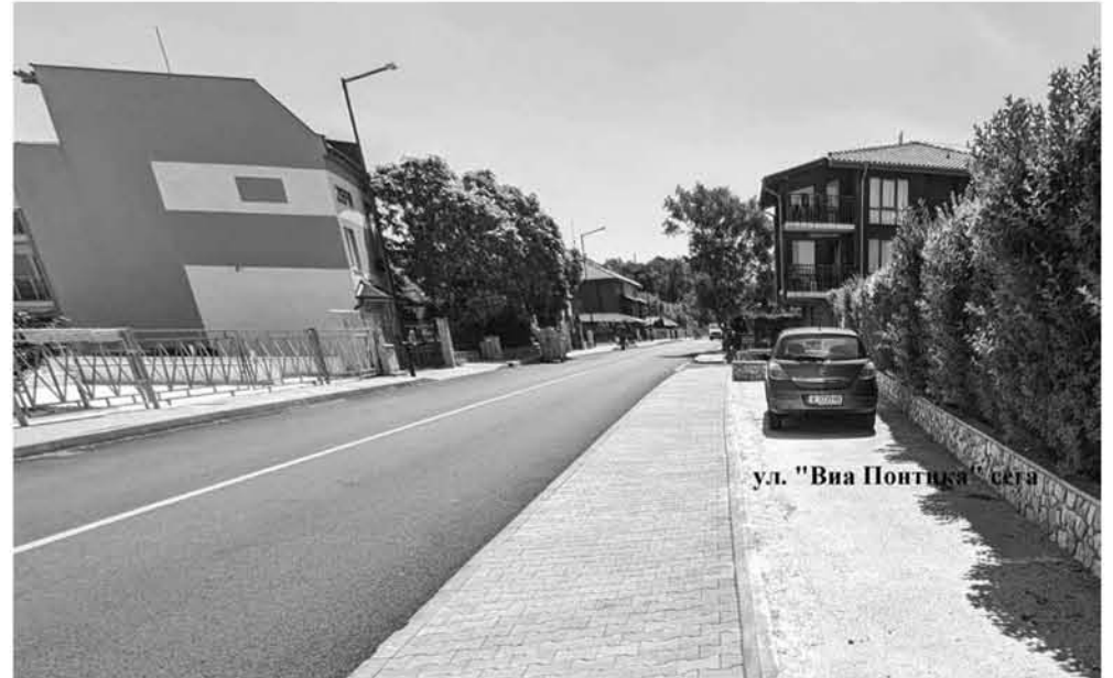
ул. „Виа Понтика“ сега

с модула Матеус, модула Реждикс и системата на НАП. С новия софтуерен продукт събираемостта на глобите е над 95%. Ето и някои цифри за сравнение в приходите от транспорт. През 2019г., когато поех управлението на общината приходите са били 279 432 лева. През миналата година – 2023, са били 1 322 544 лева. Тази година, до този момент приходите са 1 551 824 лева.