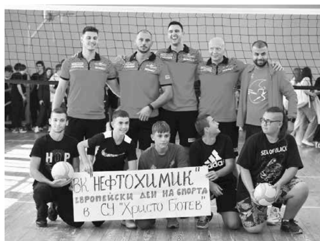
Звездите на тима: Благодарим за поканата!