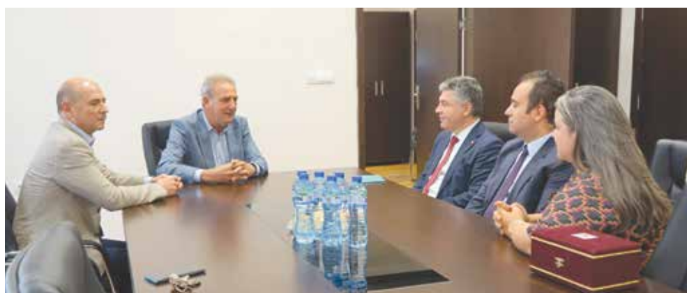
Обещаха си сътрудничество