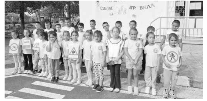
На площадката за безопасност на движението в ДГ „Славейче“ – Всички вече знаят важните пътни знаци