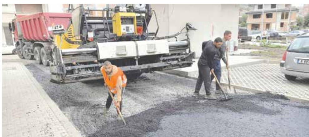
Асфалтиране в кв. 154