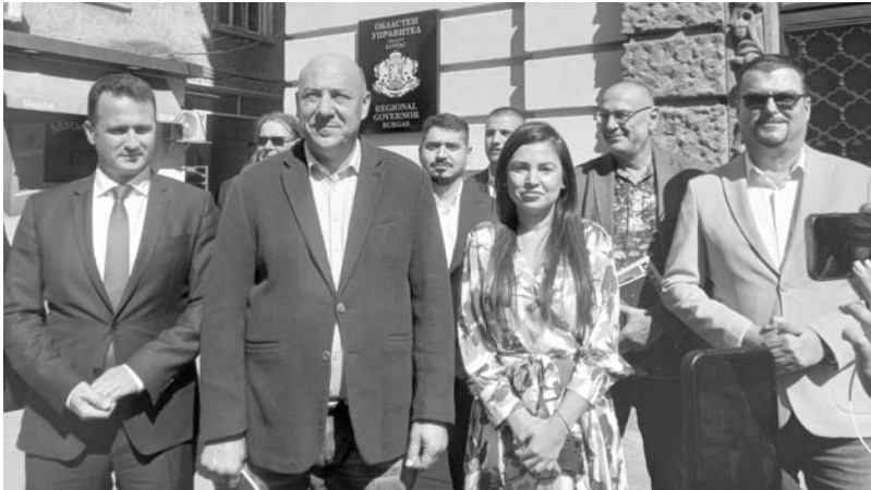
Да покажат на страната „модела Бургас“ е тяхната амбиция