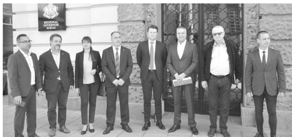
Вносителите на листата на „БСП – Обединена левица“ са убедени, че тя е силна, изградена от интересни личности