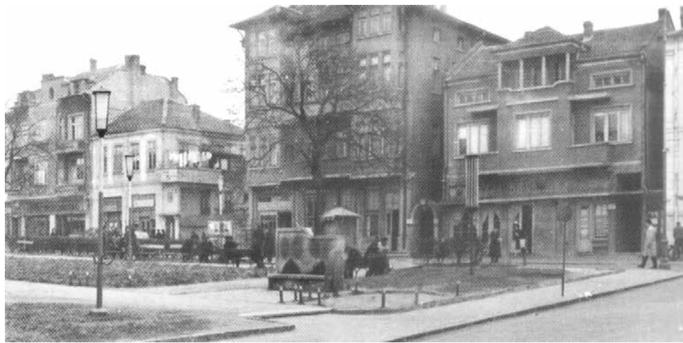
Изглед на „Тройката“ от 60-те години на ХХ век