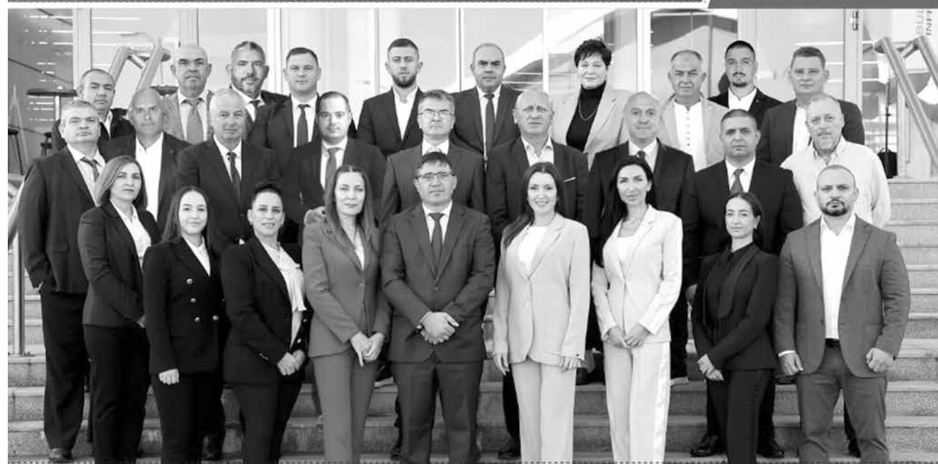
Купуването и продаването на изборни гласове е престъпление и се наказва от закона!