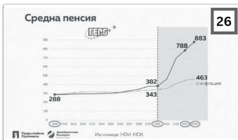
Графика на ръста на средната пенсия в България при управлението на ГЕРБ и по време на правителствата на ПП-ДБ

За коалиция ПП-ДБ можете да гласувате с номер 26 в бюлетината на 27 октомври!