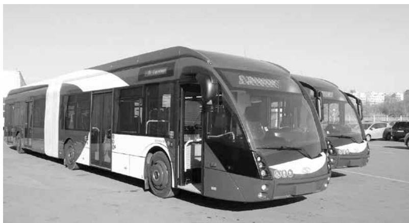
Автобусите ще тръгват от спирка „Изгрев бл.3“ в 00:00 ч., 00:30 ч., 01:30 ч., 02:30 ч., 03:30 ч. и 4:30 ч.

Спирките по маршрута ще са по желание. Автобусът ще се ползва безплатно. За гражданите със зрителни и двигателни увреждания, желаещи да ползват транспорт по предварителна заявка, ще са на разположение следните телефони: до петък – 056/831431, а в събота и неделя 056/810943. Услугата е безплатна.