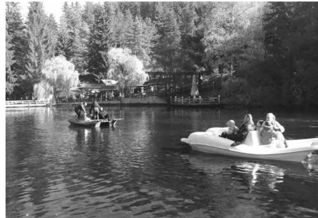
От СПА столицата на България отново изненадват с цени

„Около 200 квадрата е апартаментът, разполага със собствена сауна. На първия етаж има едно помещение и много голям просторен хол, който е 11 метра, с всекидневна. На втория етаж има три отделни самостоятелни спални, със санитарни възли, като едната спалня е по-интересна, има вана в средата на стаята. Апартаментът реално може да събере 8 възрастни. Неговата цена е около 14 хиляди лева, той вече е продаден. Свалили