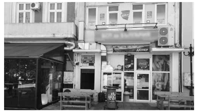
Във Входа, където се влиза за две партийни централи, е била лимонададжийницата, на която пият напитката героите на Георги Мамалев и Велко Кънев