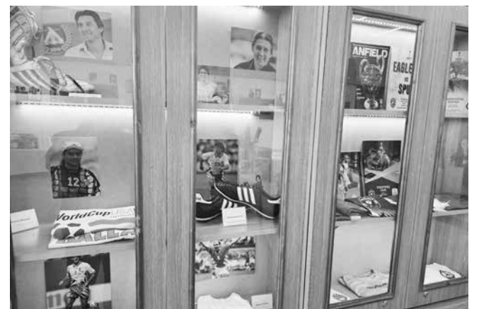
Предмети от четвъртите в света