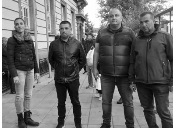
Кандидатите за депутати от листата на „Възраждане“ подкрепиха протеста

„Няма значение в коя точка на света се провеждат военни действия. Никакво бомбардировка не е в полза на човечеството. Няма значение дали това се случва в Украйна, Ливан или Палестина, войната е нещо лошо и България трябва да под-