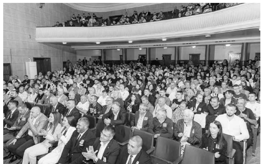
Предизборните срещи преминаха при голям интерес