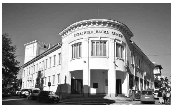
Читалището, което се вижда от прозорците на сладкарницата, също е попаднало във филма