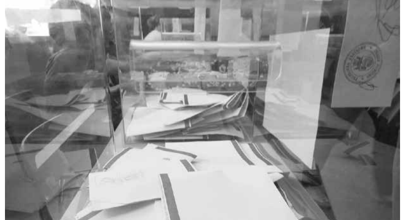
Гласуването ще става с хартиени бюлетини и машини

„Този път не са два вида избор. Предполагам, че докъм 22:30 часа да са пристигнали всички секции при нас. Прогнозата ни е, че около 4-5 часа сутринта ще бъдем готови с резултатите“, завърши председателят.