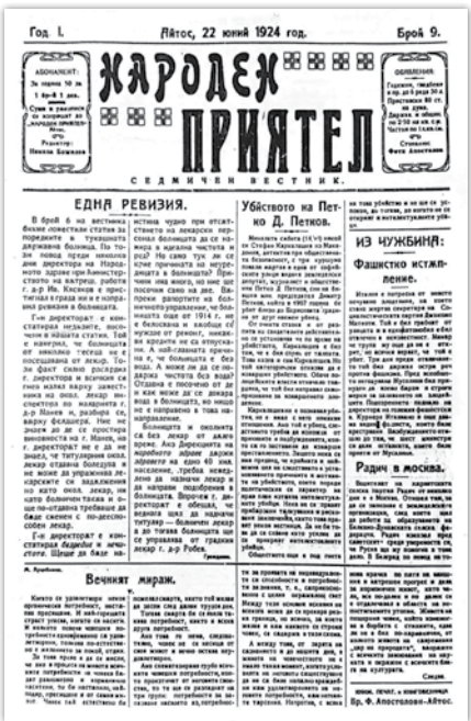
Народен приятел, брой 9, 1924 г.

*Национална библиотека „Св. св. Кирил и Методий“ – София, Български периодичен печат 1844 – 1944. Анотиран библиографски указател, том 2, Н-Я, Наука и изкуство, С, 1966. Съставител: Димитър П. Иванчев със сътрудничеството на колектив при Българския библиографски институт, обща редакция: Т. Боров, Г. Боршукон, Вл. Топенчаров. С. 14, Сигнатура В 256/4076.