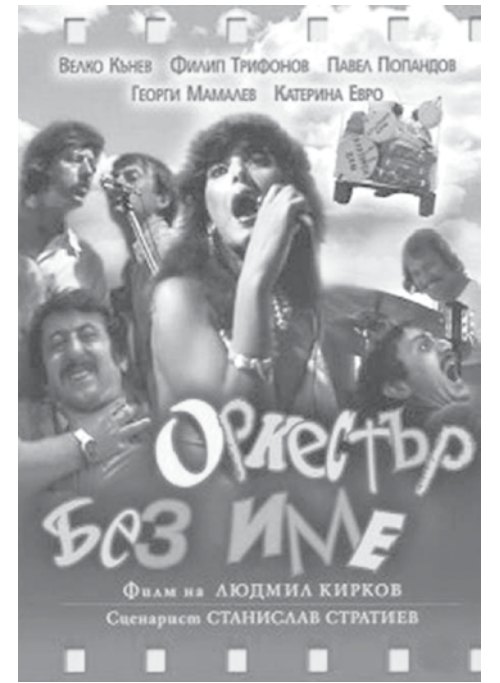
Плакатът за лентата, която е една от вечните в българското кино

Тогава, през далечната 1980 година, продукцията се снима по Южно Черноморие. Преди 38 години целият снимачен екип отскача периодично до Айтос за кадрите в началото на филма преди героите да тръгнат за турнето до Златни пясъци с големи надежди. Айтослици са горди, че е запечатана тяхната малка сладкарничка, лимонададжийницата, магазинът за грехи, дори и улицата, която води до автогара, с магазин за плод и зеленчук. През годините колкото повече се върти филмът, толкова повече нараства самочувствието на местните жители, че са били част от родната киноиндустрия. Така и времето се ражда легендата, че песента във филма „Нашият град“, изпята от група „Тангра“, е писана за техния град. В същност тя приляга на всеки малък провинциален град от онова време, „в който друго, освен да се влюбиш, просто няма какво да се случи“. Авторът на текста Александър Петров, който е един от най-известните тексто-