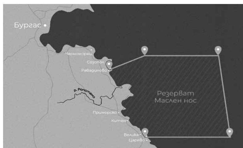
Общината е против и предложението за създаването на морски резерват „Маслен нос“

Случаят вече се описва в научна публикация и ще бъде докладван на конгрес.