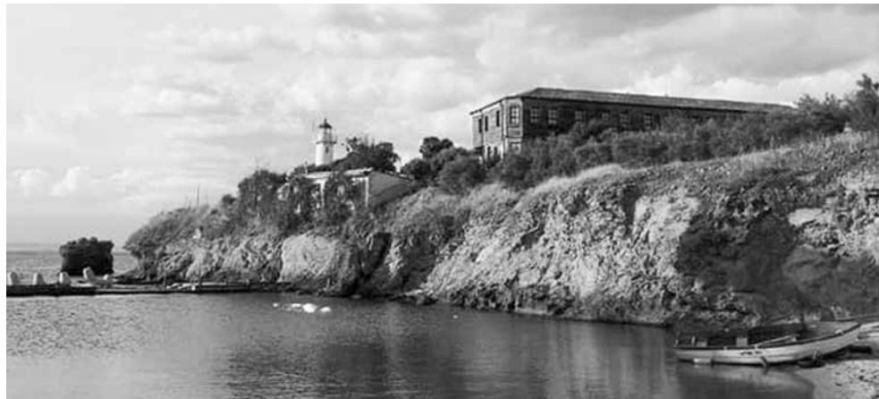
Остров Света Анастасия винаги е бил желано място за празнуване

Резервациите за острова се правят с уговорката за това, че ще се осъществят, ако метеорологичните условия позволяват. Последните години това не е проблем и компании си осигуряват незабравимо островитянско посрещане на Нова година.