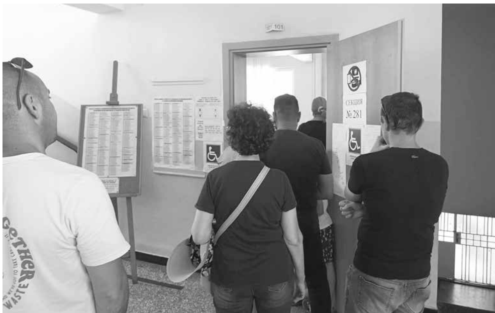
Избирателите ще отидат за седми пореден път на избори

Без грама. Само един сигнал регистриран в РИК-Бургас преди вота