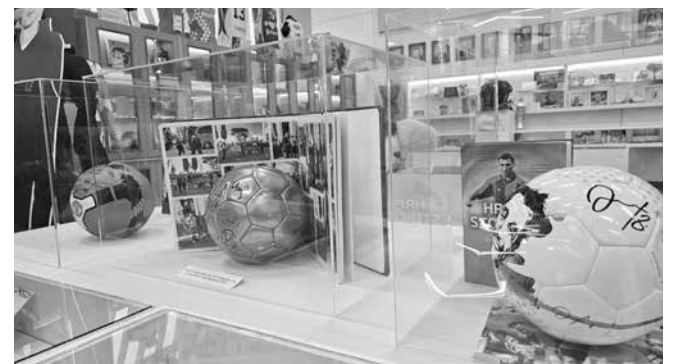
Вещи от Христо Стоичков и Димитър Бербагов заемат централна част на експозицията