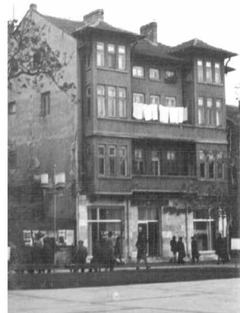
Кобареловата къща – 70-те години