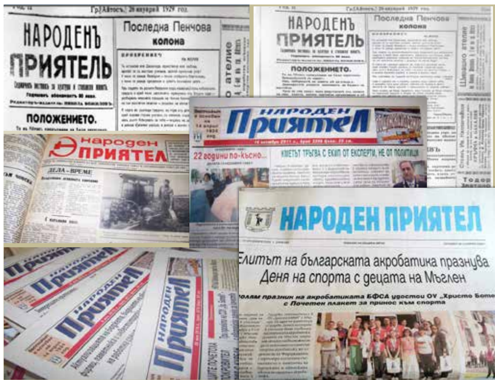
100 години Айтос пази името „Народен приятел“

Но пък се радва на доказано във времето приятелство с читателите си. Защото невъзможно е „Народен приятел“ да не бъде обичан. Тази обич към „нашите си