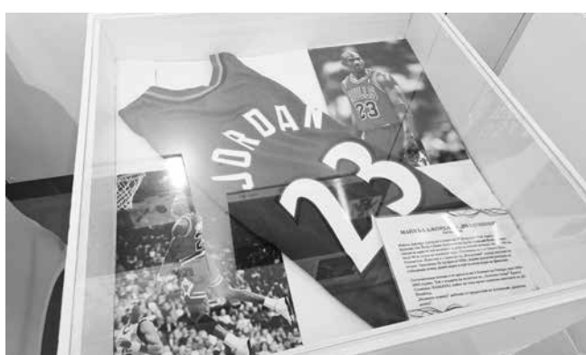
Тениска на Майкъл Джордан