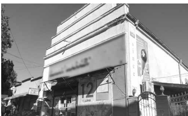
Бившето кино сега е хранителен магазин