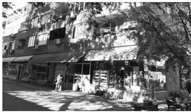
Тухленият блок и улицата до него, откъдето във филма играе музикантът, изигран от Филип Трифонов. В кадъра след това той отнася шумна плесница