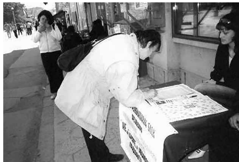
Погруска срещу стромелството на гену за отпазване на с. Малка поляна, 2002 г.

Накрая нека се обвърнем към юбилея-столетник: да бъде винаги млад и да не остарява. Да не бъде много послушен, за да бъде много обичан. Да бъде народен и винаги приятел на хората в общината. И на прага на новото столетие му казваме: Добре дошъл и на добър час!