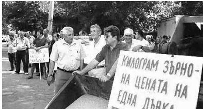
Протест на айтоските зърнопроизводители, 90-те години

Родолубието, образованието, историческата памет бяха тематич-