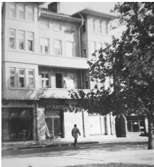
Кобареловата къща на пл. „Тройката“ преди да я съборят през 1987 г.