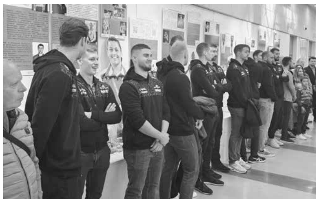
На събитието присъстваха и бургаските волейболисти от „Нефтохимик 2010“