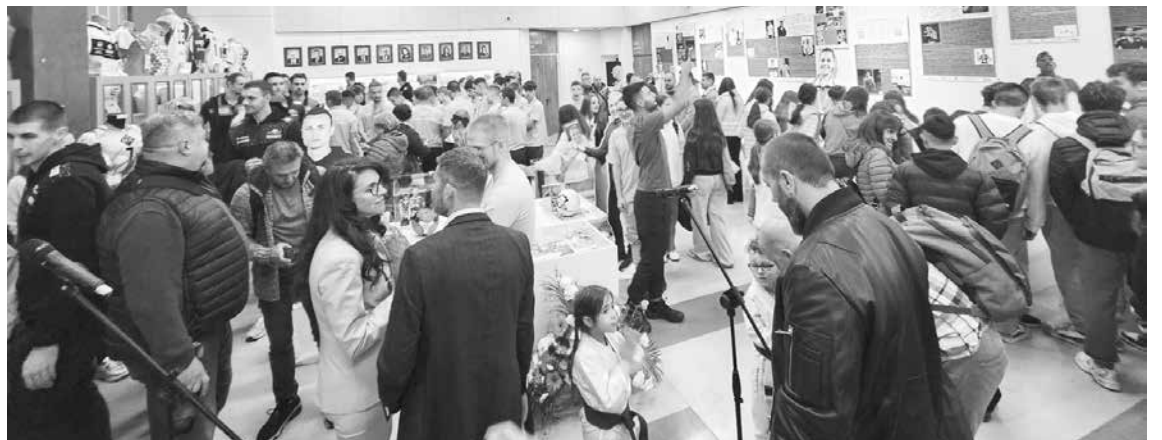
Откриването предизвика огромен интерес

Изложбата ще е в Бургас в продължение на следващите три месеца.