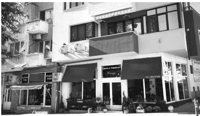
Сладкарничката срещу читалището с хубавите пастри в миналото вече е магазин за подаръци