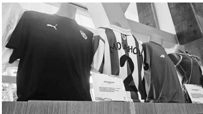
Черната тениска (вляво) е на „Бураспор“ и е дарена от Златко Янков