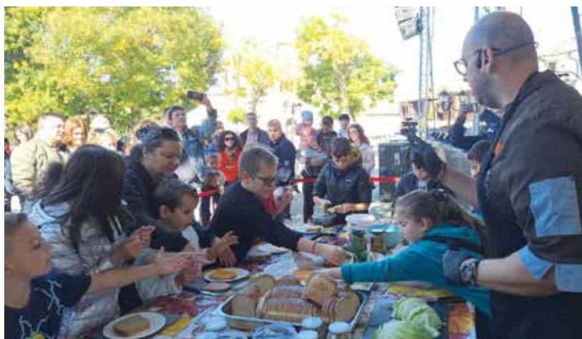
Богатата кулинарно-културна програма на фестивала, в съчетание с хубавото време събра на площад „Месамбрия“ хиляди жители и гости на града

Организацията на културните мероприятия в общината е насочена към предоставяне на качествена програма, която да привлече посетители целогодишно. В момента община Nessebar подготвя разнообразни коледно-новогодишни събития и очаква многобройни гости за светлите празници.