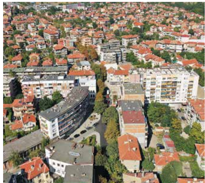
Имаше опит за изграждане на работещ Младежки център в Айтос преди 1989 г., за съжаление неуспешен