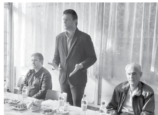
„Стременията ни са насочени към постигането на повече справедливост във всяка сфера“, заявиха кандидатите от „БСП – Обединена левица“

„Стременията ни са насочени към постигането на повече справедливост във всяка сфера – здравна, социална, образователна и правосъдна“, бяха категорични в изказванията си социалистите. Те засегнаха и проблеми от регионален характер, като посочиха какви са конкретните мерки, които могат да се предприемат за тяхното