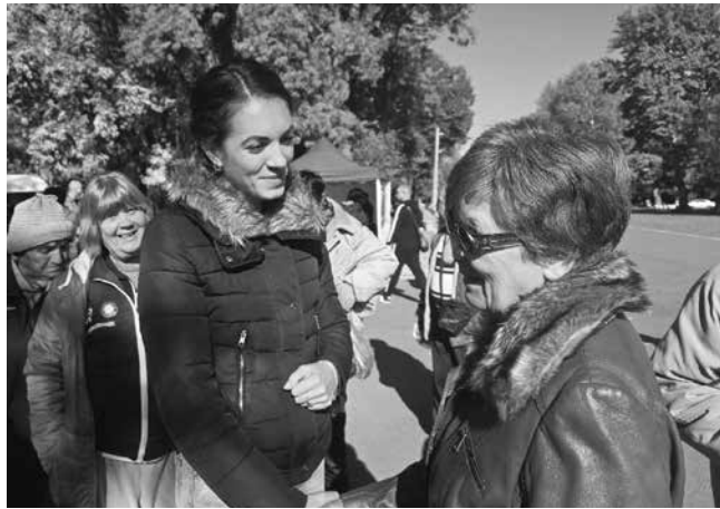
Кандидатката за народен представител бе на срещи в Средец

„Липса на улици, на тротоари, на сметоизвозване – проблеми, които не са се решавали с години, въпреки че тук 12 години управляваше ГЕРБ. Очевидно, на тях им е по-лесно да използват тези хора по време на избори, но не и да се грижат за тях. При един по-лек гъбж