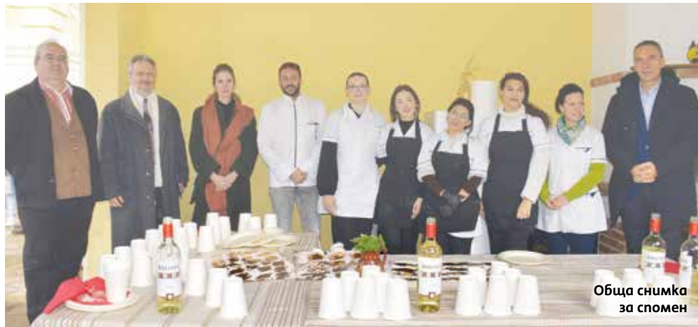
Обща снимка за спомен

Щруделът (известен при тях като ретеш), бе