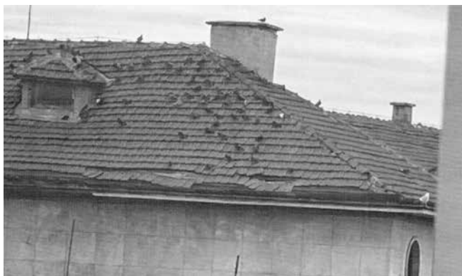
До започването на ремонта ще се осигури сигнализация за опасната зона

„Наложително е да се извършат спешни проверки и действия по отстраняване-