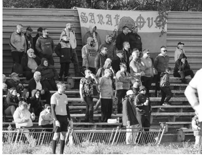
Феновете често се рагват на подобни разгромни победи

2:2 в балансиран двубой, докато „Бургас спорт“ постигна победа с 4:2 като гост срещу „Странджанец“ (Царево), затвърждавайки позицията си в челото на