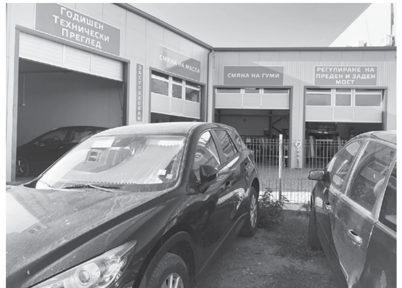
Изчакващи ред за годишен технически преглед

Към днешна дата прегледите в пунктовете се провеждат по правилото – 14 дни за отстраняване на неизправностите и последващо спиране на автомобила от движение, в случай че не влезе в норми. В този краен изход от техническия преглед в „Н-32“ е разписано, че „превозното средство не се допуска да се движи по пътищата, отворени за обществено ползване“. Отговорността за преместването му до отстраняване на неизправности-