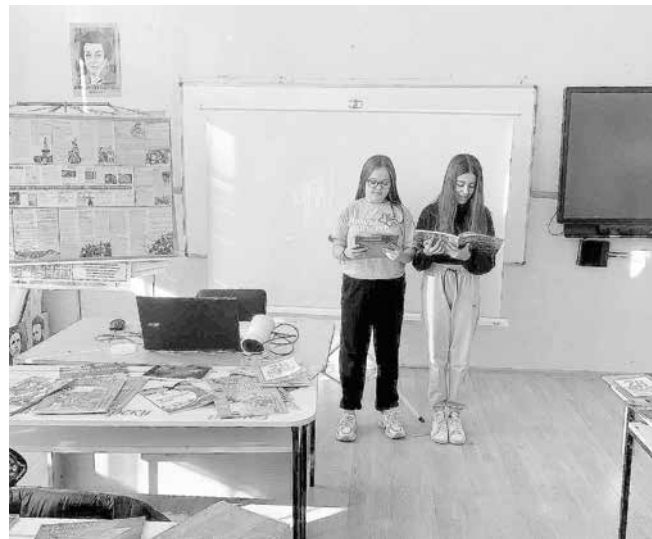
Учебната среда се отразява и на оценките