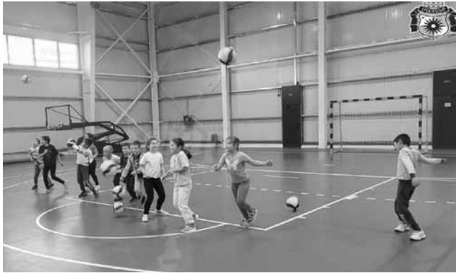
Закритата зала „Арена Несебър“ е един от важните спортни центрове в общината

Закритата зала „Арена Несебър“ е един от важните спортни центрове в общината. Тя бе построена, за да задоволи нарастващата потребност от инфраструктура, пригодена за ползване през всички сезони. Залата предоставя условия за тренировъчна и състезателна дейност и се ползва както