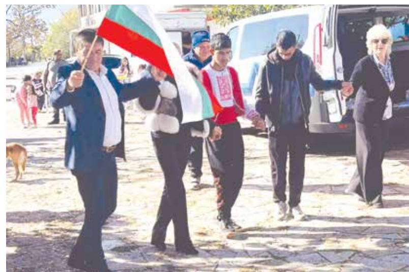
По традиция кметът на селото поведе хорото