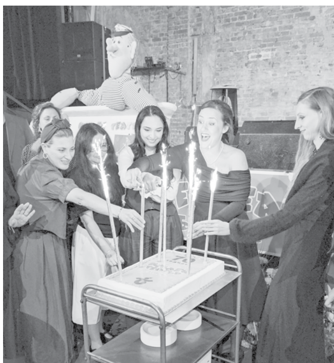
Около празничната торта

артисти, режисьори и сценаристи, които са създавали възлюбването на кукления театър.