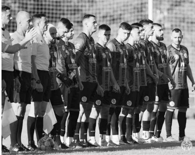
„Зелените“ уверено крачат към промоция

„Черноморец 1919 II“ (Бургас) постигна победа с 2:0 над „Вихър“ (Айтос), което ги приближи още повече до първото място. В друг оспорван двубой „Българово 1948“ успя да се наложи над ОФК „Поморие“ (Поморие) с 2:1, грабвайки важни три точки.