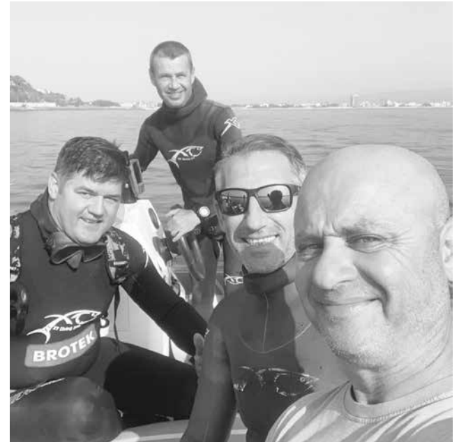
Най-силният клуб в страната е шампион на последните седем поредни държавни турнира

Състезателят на бургаския отбор стана рекордър с най-много индивидуални титли или общо 13 в историята на подводния риболов в България.