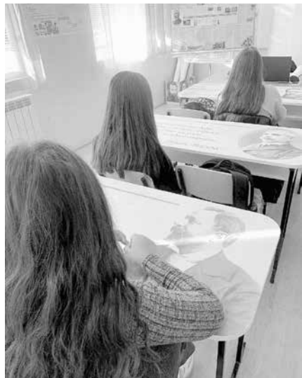
Няма как да си неподготвен, ако от чина те гледа... Алеко Константинов

Учениците в село Карагеоргиево ще изучават български език и литература върху чиновове с ликови и мисли на известни български личности – поети и писатели като Паисий Хилендарски, Иван Вазов, Христо Ботев, Алеко Константинов, Йордан Йовков, Елин Пелин и др. Чиновите са закупени по Национална програма „Осигуряване на съвременна, сигурна и достъпна образователна среда“. Кабинетът разполага още с екран за проектор, стойки за табла, както и с десетки табла, свързани с материала по български език и литература в прогимназиален етап.