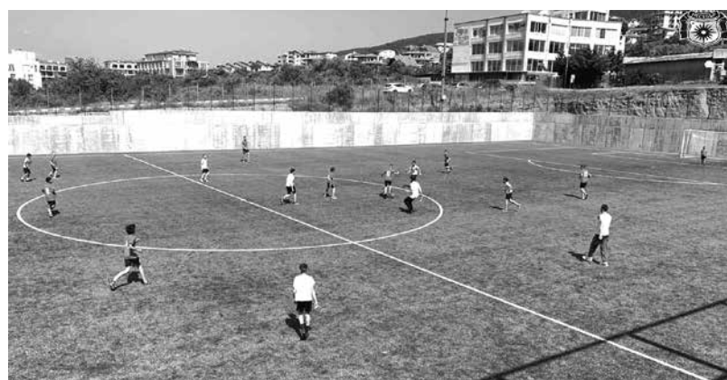
Общината има и няколко модерни стадиона