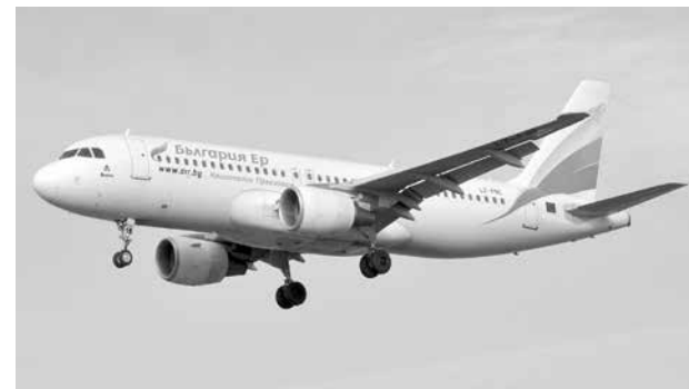
Авиокомпанията превозвач е Bulgaria Air

В социалните мрежи хора, запознати вече с разписанието на полетите, коментират, че нито дните, нито часовете са подходящи.