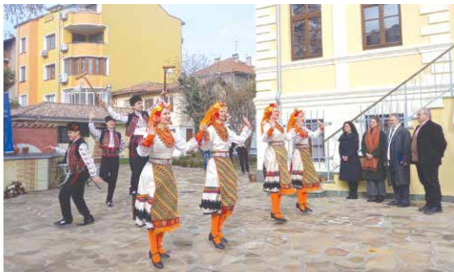
„Ансамбъл „Странджа“ се погрижи за настроението

В изложбата може да се разбере защо унгарците са царе на сладкишите, историята на всеки един тях – от щрудела, до торта „Добуш“, която е конкурентна на прочутата виенска „Сахер“ може да се види, както и как е възникнал бугапещенският Миньон, тортата „Янчи Риго“, както и палачинка „Гундел“.