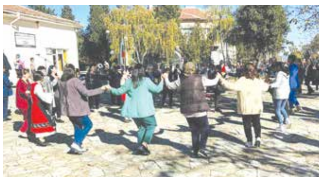
Много айтозлии с карановски корен дойдоха на празника