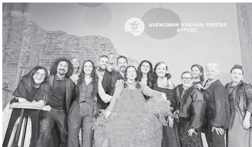
Обща снимка на екипа на театъра

Бургаският куклен театър празнува 70-и рожден ден с приятели и почитатели на изкуството, навръх Деня на народните будители, 1 ноември. Един от акцентите в събитието бе премиерата на фотоалбума „Съкровища“, с автор актрисата Лилия Атанасова, която е част от екипа на театъра 30 години. Изданието разказва историята на театъра до наши дни и съдържа архивни снимки, кадри от емблематични постановки, както и моменти зад кулисите, като начин да се отбележат усилията и талантите на поколения