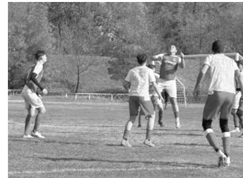
Юноши младша възраст

гледане спектакъл, но за съжаление „Вихър“ загуби срещата. Много положения пред двете врати, спасявания на вратарите и пропуски на полевите играчи. През второто полувреме отборът на „Вихър“ беше почти единичен господар на терена и отпрати голям брой удари към и във вратата на дома-