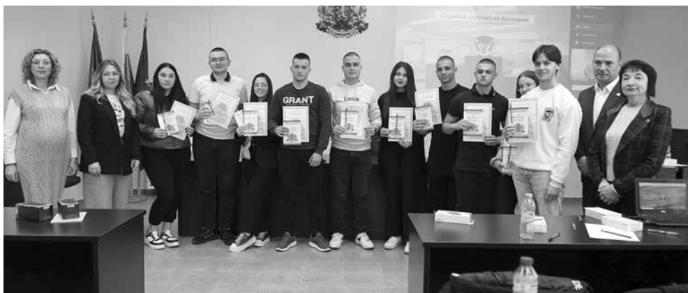
Победителите от 12Б клас