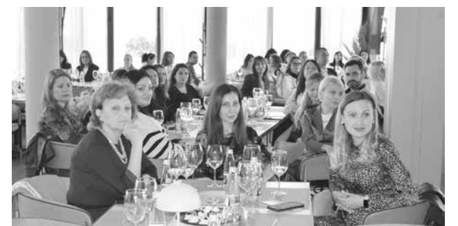
Много млади учители намират своето работно място в Бургас. Заслуга за това имат и двата университета, които обучават бъдещи педагози

Рейтинговата система на висшите училища в страната бе публично представена от служебния министър на образованието Галин Цокров в края на миналия месец.