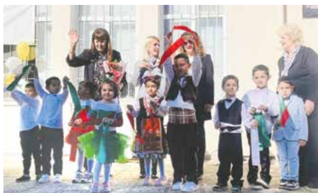
Детската градина в Караново от 50 години е филиал на ДГ „Здравец“ – Айтос