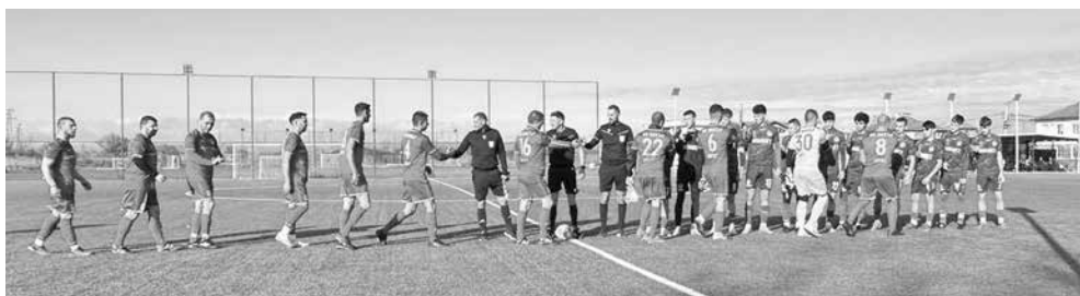
Мъжкия отбор на „Вихър“ срещу „Черноморец II“