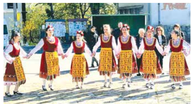
Както всяка година – много фолклорни състави на празника