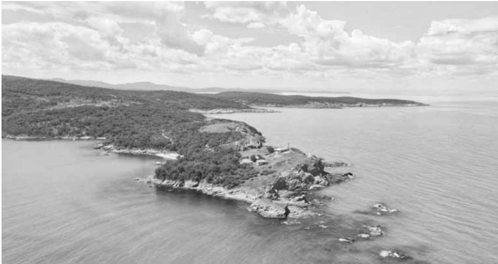
Резерватът, който природозащитниците искат да се създаде, да носи името на нос Маслен нос

Искане. От „Възраждане“ зоват за извънредна сесия на Общински съвет – Приморско