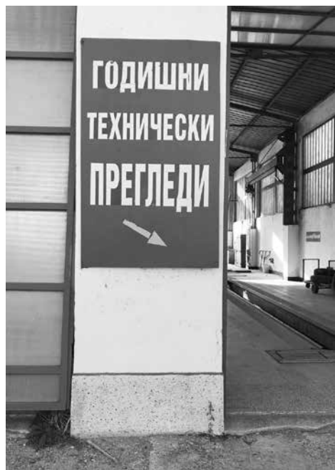
Пунктовете за ГТП и автомобил с повече от един отказ се наблюдават от Министерството на транспорта на РБ

Според друг пункт за ГТП към „Кю-сервиз“ – Поморие, малко след влизането на Наредба Н-32 са върнали на първите 200 влезли за преглед коли, не повече от 10. „Не мога да се съгласяя, че се връщат 70% от автомобилите. Най-трудни са колите от 2004 г., защото не са на реални километри и катализаторът в повечето случаи е изваден. Точно при тях са завишени нормите на отработените газове. Имаш катализатор няма проблем; нямаш – проблемът е голям! Нямам съмнение, в който 9-10-годишна кола да не влезе в нормите на измерването. Говорим за бензинови двигатели. Дизеловите са безпроблемни. При тях се измерват твърдите частици. Те не отделят при работата си въглероден