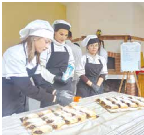
Учениците от ПГТ „Проф. д-р Асен Златаров“ се справиха блестящо с приготвянето на сладкиша