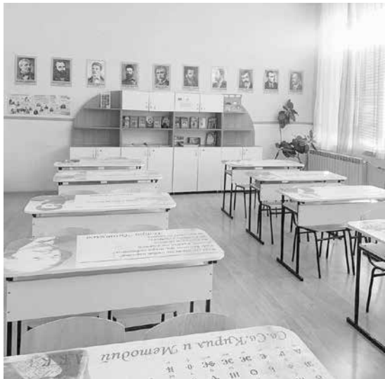
Много градски училища нямат толкова добре уреден кабинет по български език и литература