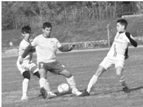
Набор 2010 – 2011 г.

На следващия ден, в неделя, на 10 ноември, мъжкия отбор на „Вихър“ гостува в Долно Езерово на отбора на „Черноморец II“, Бургас. Мача, както винаги коментира Станимир Генев, „Доста привлекателен за