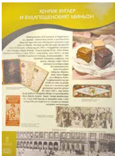
Изложбата показва историята на известните и елитни унгарски сладкиши