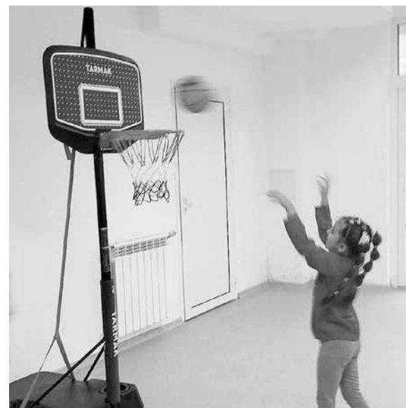
Малък баскетболен кош за малките баскетболисти