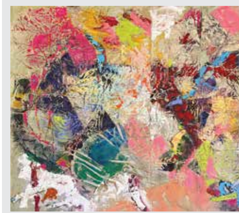
ИЛИЯН ИВАНОВ Лов на пеперуги акр./платно 135 x 135 см 2022