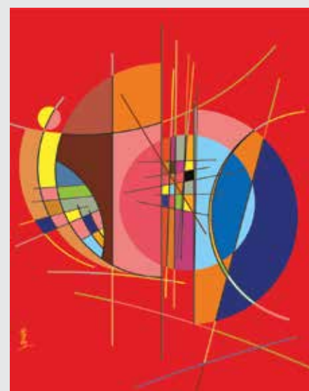
СТОЙКО САКАЛИЕВ Разделена форма CGD 64 x 82 см 2020