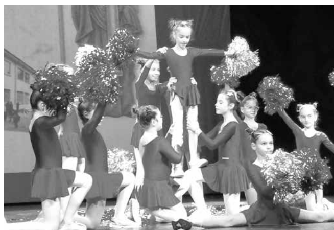
Малките мажоретки спечелиха публиката