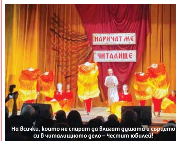
На всички, които не спират да влагат душата и сърцето си в читалищното дело – Честит юбилей!