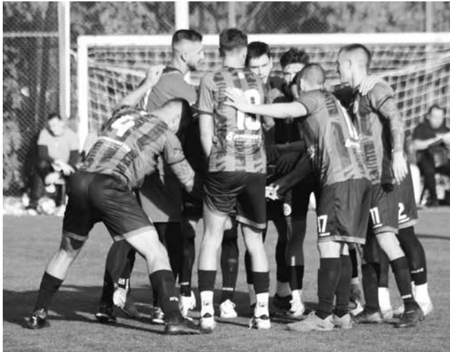
„Нефтохимик“ продължава да е лидер и уверено върви към промоция във „В“ група