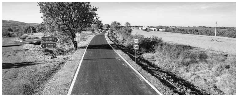
Завършиха основните дейности по реновирането на пътя от село Велика до село Фазаново. Един проект от изключителна важност за местните хора и такъв напълно описващ политиката на местната власт – да отвори туризма към Странджа, където е скрито съкровище от традиции, бит и култура

„Работим за гражданите, за подобряване на инфраструктурата, за развитие на регионите. Бургас е един от важните региони, защото през тази година се вижда ръст на туристическия продукт в България. Още от сега трябва да започнем да