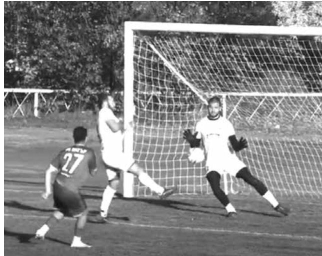
Айтоският „Вихър“ претърпя разгромна загуба като гост в Българово