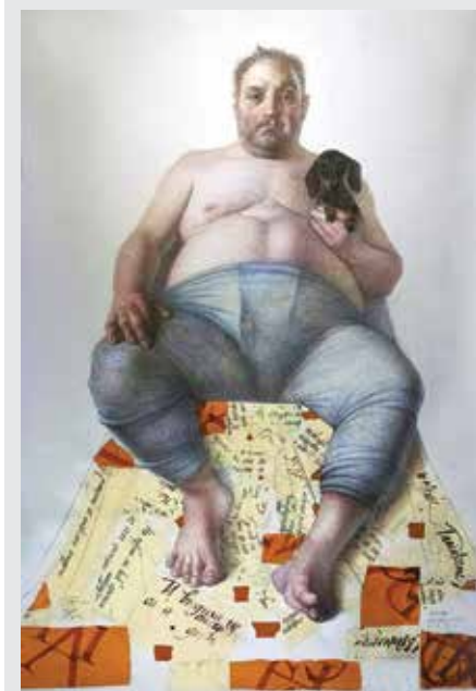
АТАНАС АТАНАСОВ Гришата и Арчи цветни моливи/ хартия 150 x 210 см