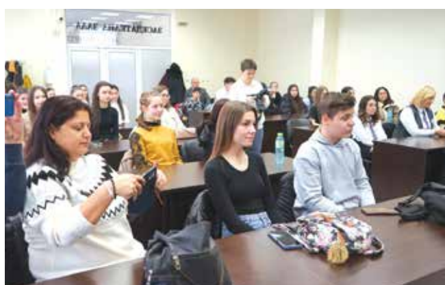
Домакини и гости по време на церемонията