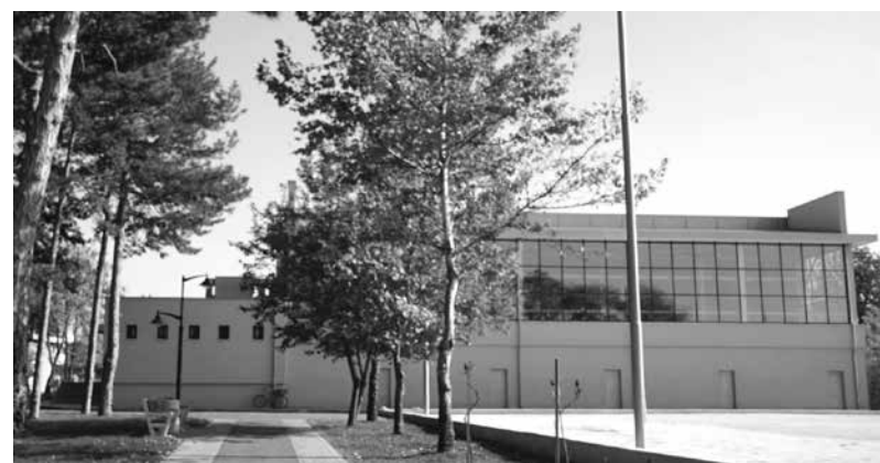
В Спортна зала „Аетос“ ще тренират и ще се състезават ВК „Айтос“ и БК „Вихър“ – Айтос