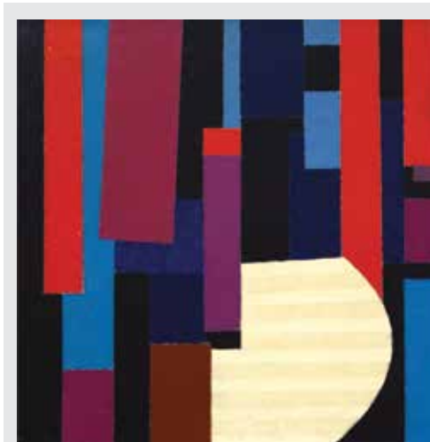
ГЕОРГИ ЯНАКИЕВ Музика м.б./платно, 80 x 80 см, 1978 инв. № 674, собственост на БХГ „Петко Загорски“

Изложбата се открива на 2 декември 2024 г. от 18 часа в КЦ „Морско казино“, зала „А.Г. Кожикафалята“.