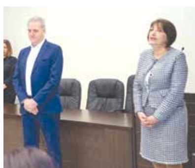
Директорът на СУ „Никола Й. Вапцаров“ приветства участниците