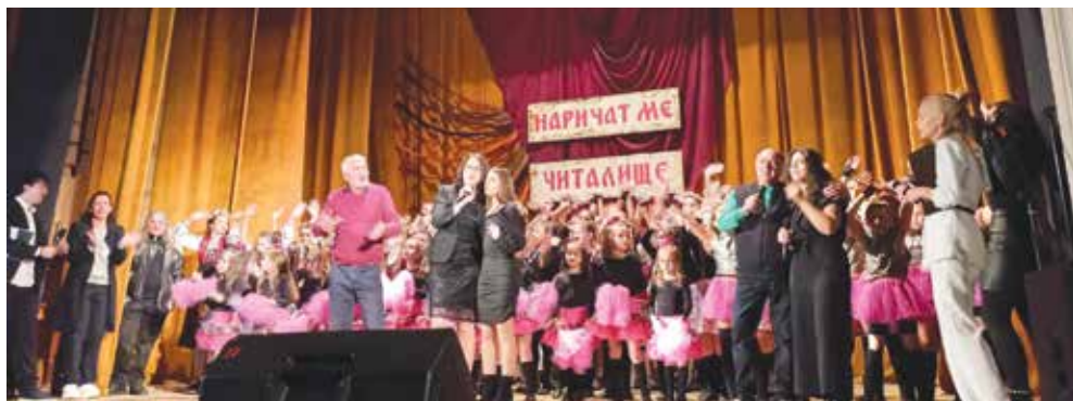
През 2069 година потомците ще четат посланията на читалището от 2024 г.

Вълнуващ беше юбилейният концерт „Наричат ме Читалище“, посветен на го-