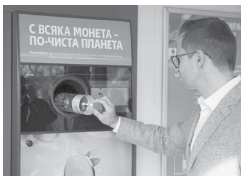
Първият автомат за рециклиране на опаковки в Бургас е в Kaufland