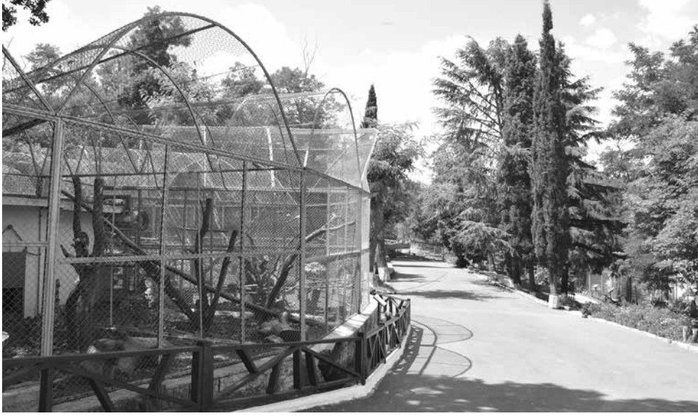
Айтоският парк вече с ясна стратегия за следващите 10 години

Разработките ще подпомогнат Община Айтос да кандидатства за последващо финансиране