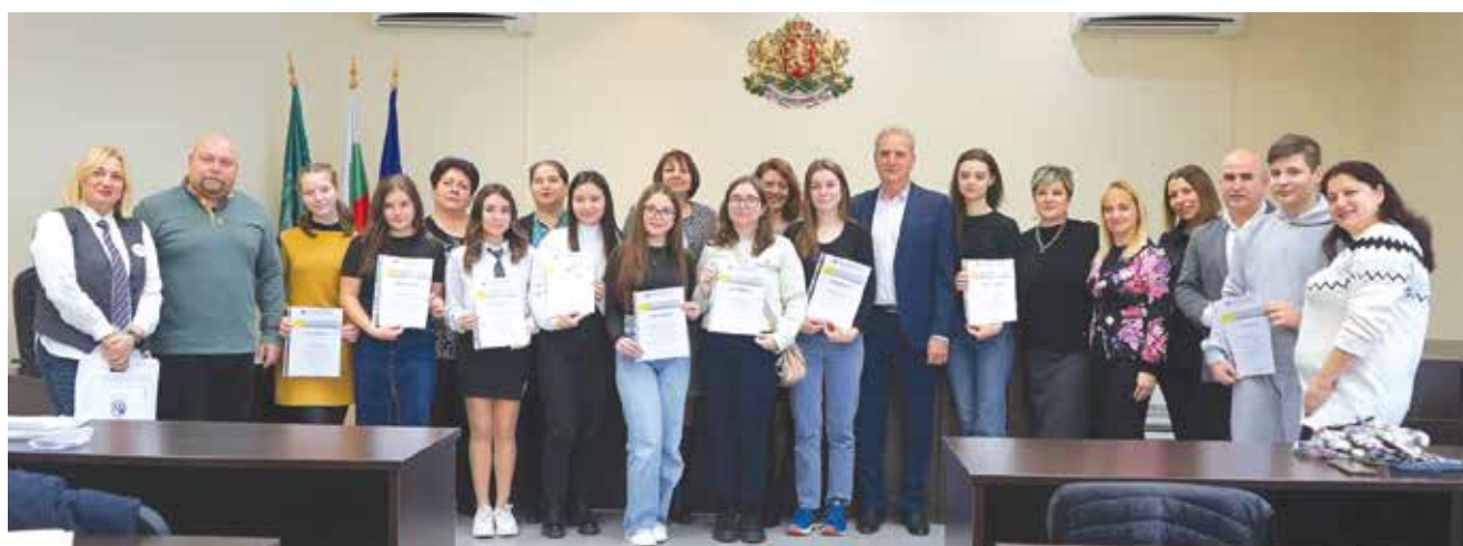
Участници, преподаватели и гости на VII състезание по писмен превод

Ще припомним, че първите две издания бяха вътрешноучилищни, пре-