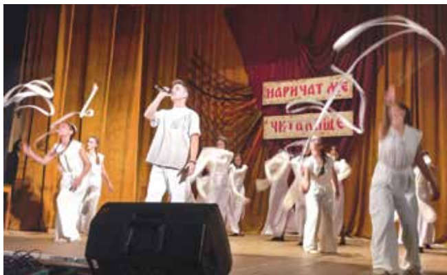
Много таланти са имали своя дебют на айтоската читалищна сцена