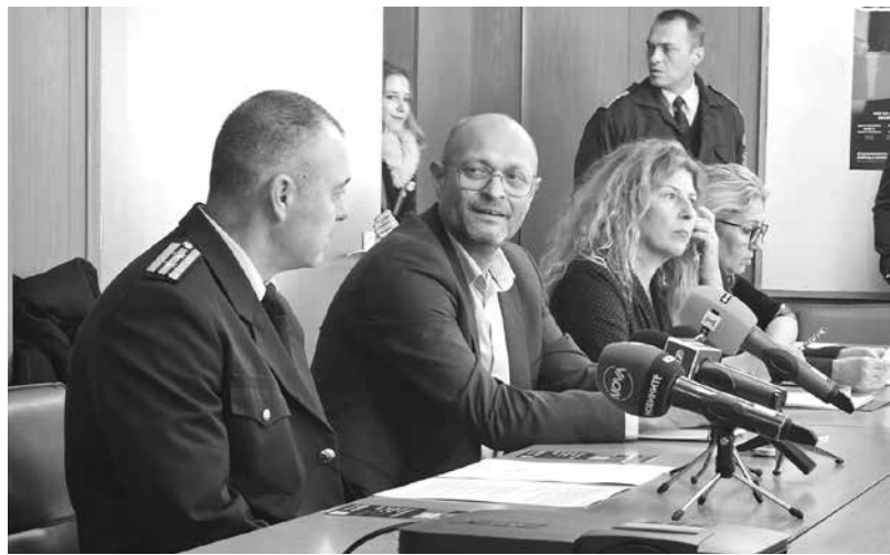
Съд, Прокуратура и Полиция отчетоха и законодателни промени, които влияят на статистиката

„За периода до 31.10.2024-а на територията на ОДМВР - Бургас са регистрирани и се осъществява контрол по общо 341 заповеди за защита по Закона за домашното насилие. За същия пе-