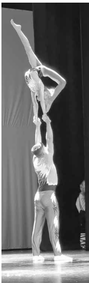
Спирато дъха изпълнение на двойката акробати

Подгредени бяха изложби, представящи историческото развитие и успехи на училището, проведеха се творчески работилници, срещи с бивши директори, учители и възпитаници на училището, споделиха се добри педагогически практики чрез открити уроци и представителни изяви на клубовете по интереси.