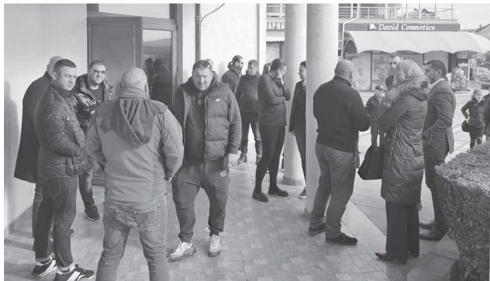
На срещата освен жители на Приморско, присъстваха и хора от Царево и Созопол

Представители на рибари от трите общини говориха за това, че основният проблем тук е праленето и няколкото изоставени мидени ферми и че заради това няма нужда да се създава резерват, а просто отговорните институции да си свършат работата. Друг проблем, който местните видяха е, че на тази среща не са посочени никакви параметри и рестрикции и попитаха как