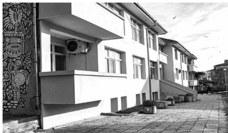
Започна обновяването на двора на детска градина в град Ахтопол

работим за следващия туристически сезон и да обезпечим и пътната, и водната инфраструктура. Вече имаме сключени договори за текущ ремонт и поддръжка