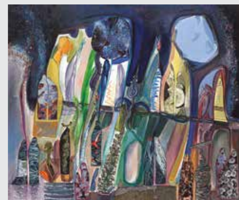
ГЕОРГИ ДИНЕВ Горната и долната земя акр./платно 100 x 120 см 2016