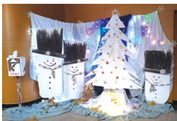
Пощенската кутия е във фоайето на читалището

Писмата пускате в специално подготвената пощенска кутия във фоайето на читалището от 27 ноември 2024 г. до 17 декември 2024 година.