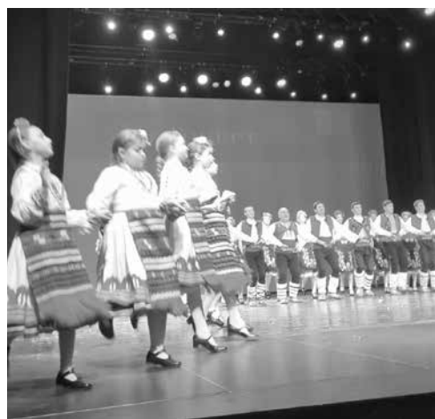
Народните танци обединиха на сцената няколко поколения