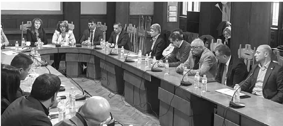
Работната среща на кметове от региона с министър Коритарова

Основен приоритет и през следващата 2025 година за него е администрацията да запази доброто отношение