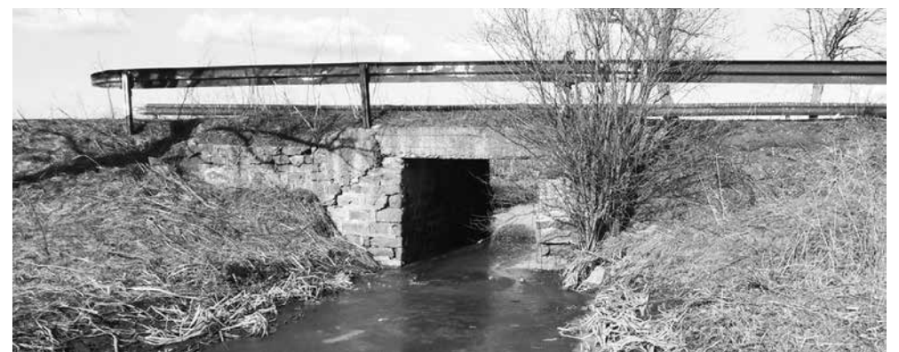
Община Камено има подписани споразумения за стартирането на три значими проекта, които ще подобрят инфраструктурата и условията на живот в района. Първият проект включва изграждането на надлез по пътя Ливада – Тръстиково, който ще улесни транспортната свързаност. Вторият проект е насочен към рехабилитация на пътя от Тръстиково до Константиново, за да осигури по-безопасни и удобни условия за пътуване. Третият проект е реконструкция на водопроводната мрежа в село Полски извор.

За догодина в община Камено планират да си довършат връзките на четвъртокласната пътна мрежа, да се сменят водопроводи, да се работи върху инфраструктурата.