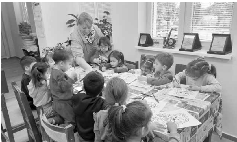
В библиотеката на НЧ „Пробуда 1929“