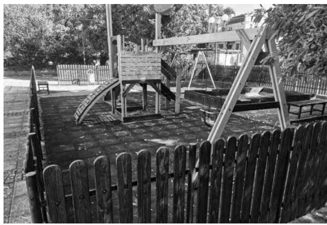
60 000 лв. инвестира община Карнобат в основен ремонт на пет детски площадки на територията на града

„Община Карнобат е финансово стабилна, разчитайки основно на собствени приходи, които никак не са малко. Прогължаваме да получаваме сравнително висока събираемост от местните данъци и такси и от другите ни неданъчни приходи. Общината разполага