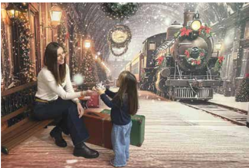
Индивидуални или колективни фотосесии

фера и ще ви даде възможност да заснемете различни и вълнуващи моменти.