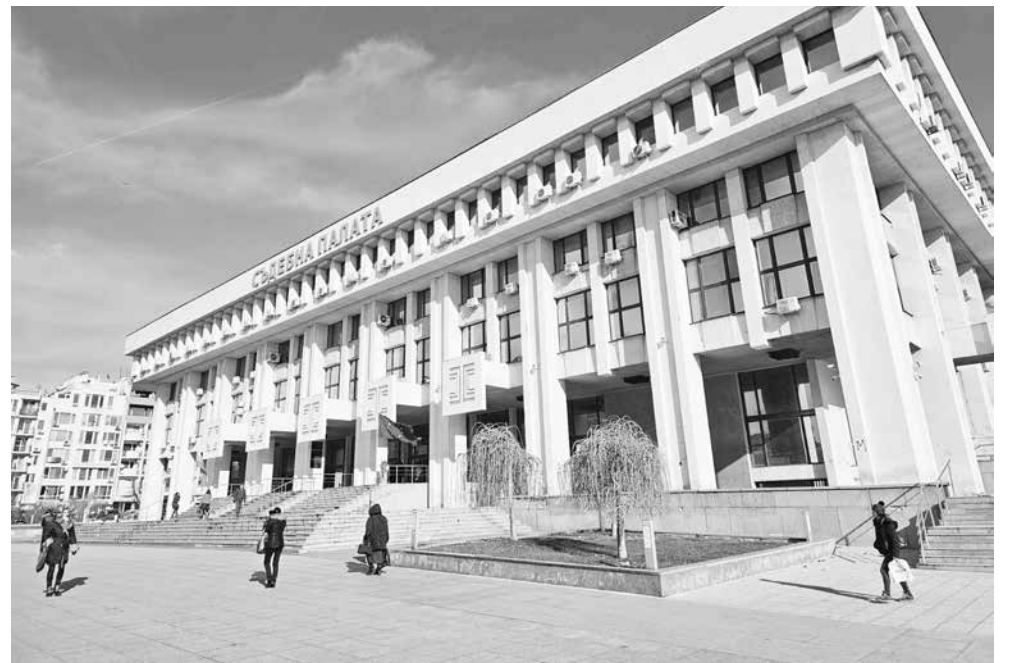
В Съдебната палата в момента се помещават три прокуратури – Районна, Окръжна и Апелативна, и четири съдилища – Районен, Окръжен, Апелативен и Административен

„Да, има такова писмо. Все още няма становище на администрацията, защото е получено вчера (б.а. сряда следобед). В момента се подготвя процедура за обявяването на международен конкурс за изработването на проект за целия терен“, отговориха от Община Бургас за „Черноморски фар“.