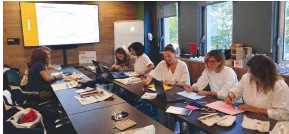
В обучителния курс „ИКТ в класната стая: иновативни инструменти за улесняване на ученето, сътрудничеството и творчеството на учениците“

Разбира се, преживяването ни не се ограничи само до обучението. Лисабон ни плени със своята красота и културно наследство. Посетихме величествения манастир Жеронимуш, разгледахме Белемската кула и се разходихме из тесните улици на Алфама. Лисабон е град, който вдъхновява. Енергията, която получихме там, ще ни мотивира дълго време.