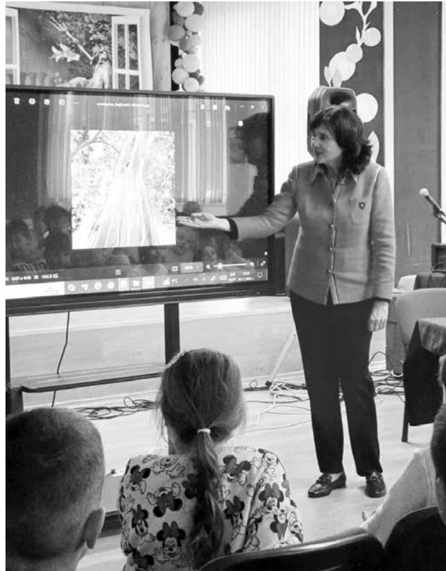
Авторката по време на открития урок

Благодарим и на приятелите от Издателска къща „Знаци“ и Народно читалище „Фар“, които бяха с нас.