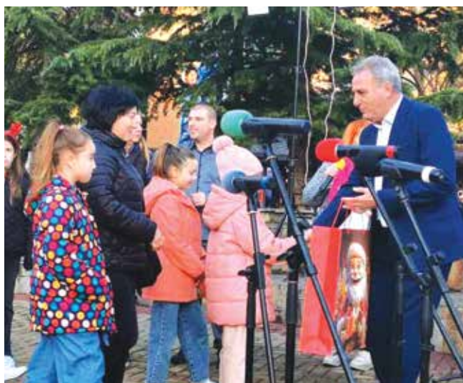
Вместо Дядо Коледа, кметът зарадва децата с подаръци и лакомства

През декември най-очакван е Общинският коледарски празник, посветен на Коледа и Сурваки. Тази година празникът-конкурс ще се проведе на 18 декември, от 13.00 часа, на площад „Свобода“. В програмата са включени и конкурси за обреден хляб и за автентична сурвачка. Организатори са Община Айтос, НЧ „Васил Левски 1869“ и СУ „Христо Ботев“, наградите осигури Общината.