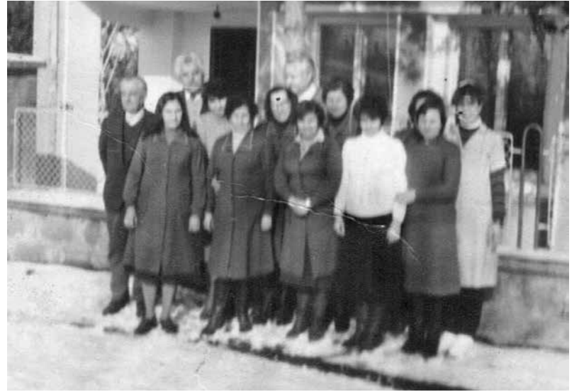
Заедно с екипа на счетоводството на ТКЗС-то в Соколово през 1982 година

Висше икономическо образование не е било необходимо в предходния строй, за да работиш като плановик в ТКЗС. Желателно – да, но по-важно от това да си топил студентската банка 4 години за диплома е било следването на партийната линия от агиттаблата – пети-