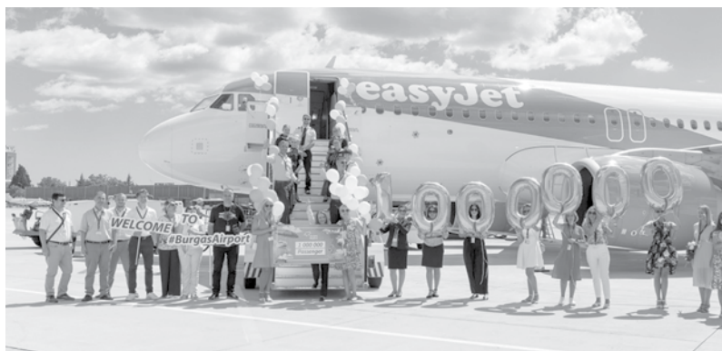
Тази година милионният пътник кацна с полет на easyJet от английската столица Лондон, затвърждавайки Великобритания като пазар №1 за морския аеропорт

Най-важният показател за дейността на местата за настаняване е броят на реализираните нощувки. Въпреки лекото намаление на лег-