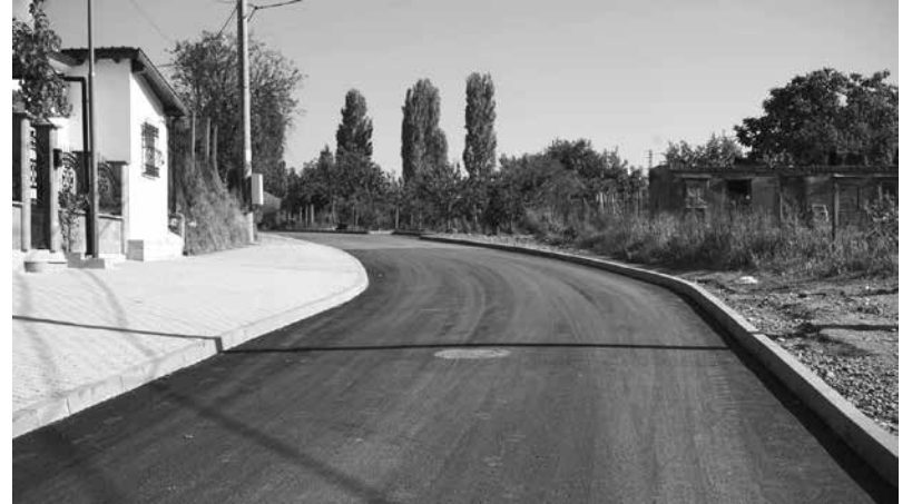
ул. „Арда“, гр. Айтос

По проекта Община Айтос извърши ремонтни дейности по улица „Даме Груев“ и улица „Зюмбюл“ в град Айтос. Основните дейности, които се изпълниха по проекта са реконструиране и рехабилитиране на 899 кв.м. тротоарни и 1906 кв.м. улични настилки, изграждане на бетонови бордюри