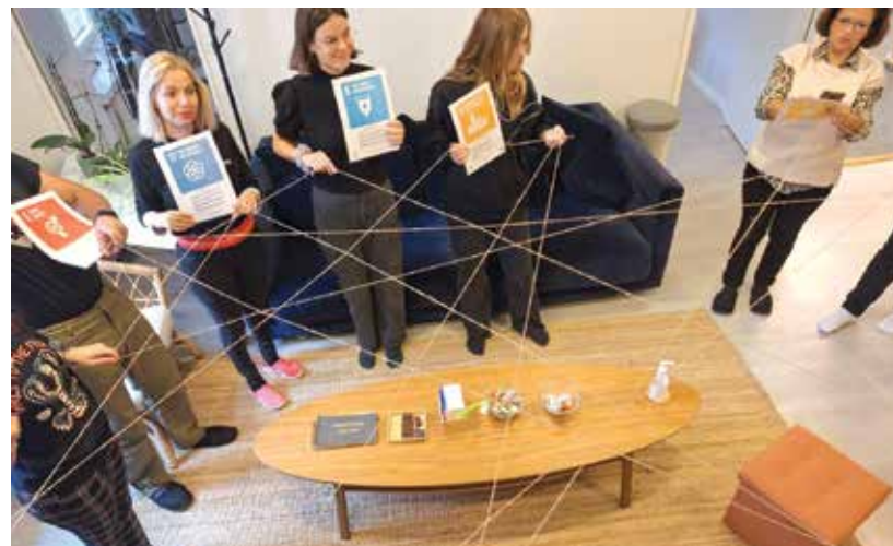
Учителите на СУ „Христо Ботев“ участваха в практически семинари, дискусии по групи и работа по проект