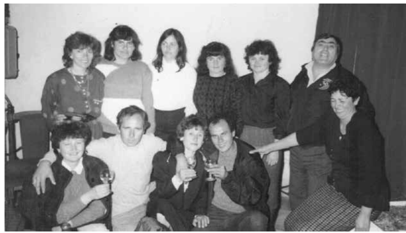
С колектива от с. Тополица на „Шатрата“ – гр. Айтос

летката за три години. „Аз не бях с висше. Завършила съм Селскостопански техникум със специалност „Лозаро-овощарство“. Но истината е, че тогава не държаха и много на образованието. Въпросът беше да вършиш работа“.