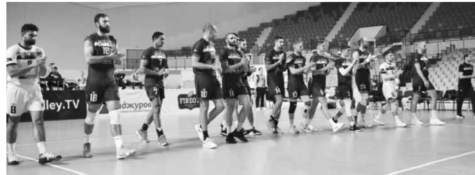
Въпреки че от самото начало е предвидено в залата да се играе и волейбол, това не се случва много често