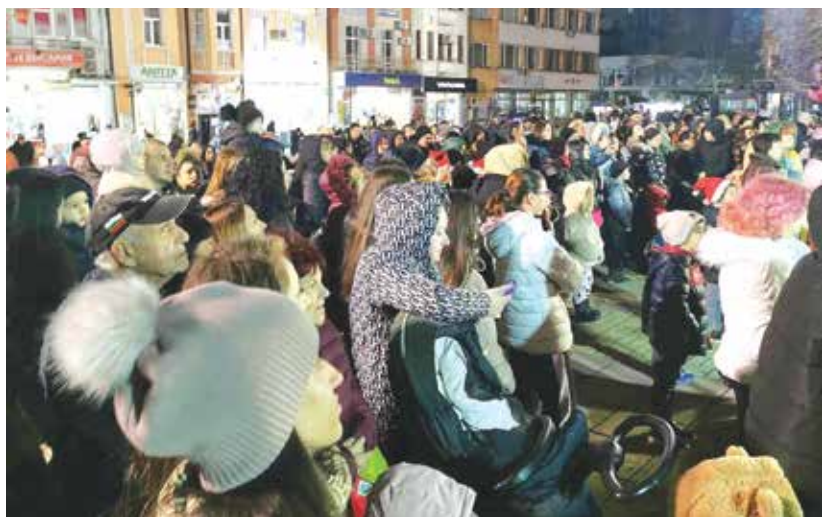
Коледно настроение на площад „Свобода“