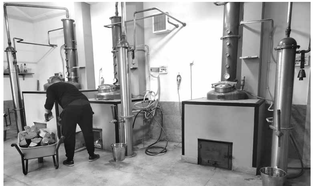
Времето на селските казани за варене на ракия все още не е отминало

Оцетната киселина и нейните производни (естери) могат да се образуват