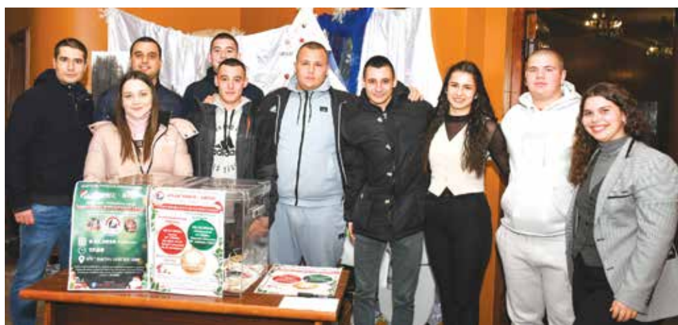
Млади и енергични – екипът на „Бъди човек“ – Айтос

И тази година кампанията запали желанието на училища, детски градини, институции, спортни клубове и художествени състави да се включат в предколедния спектакъл. Между първите, пожелали да