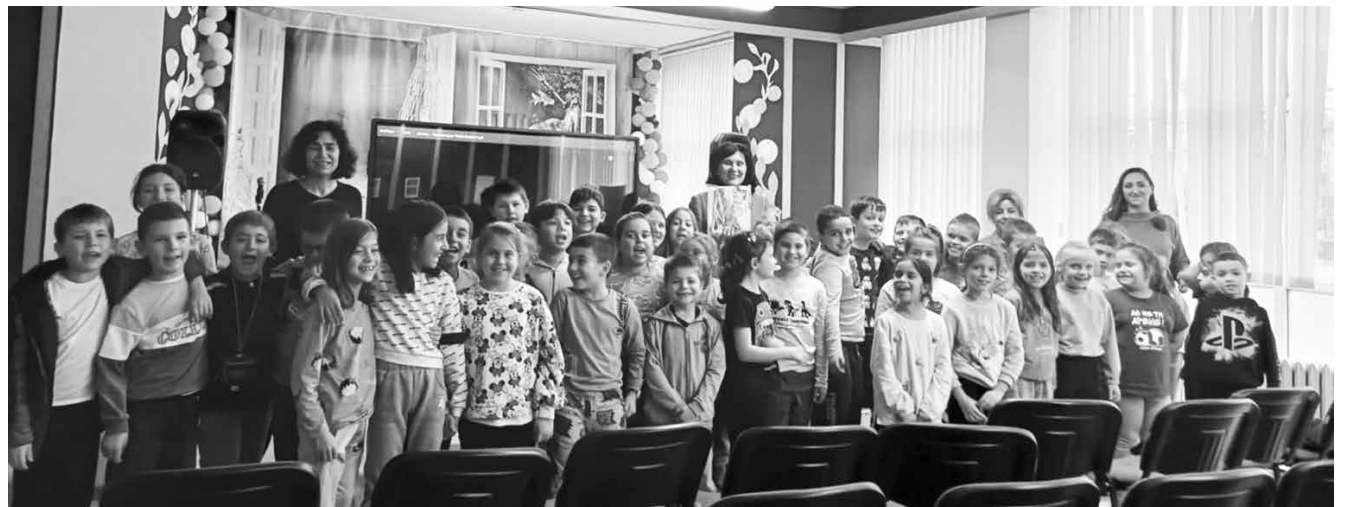
Общата снимка запечата спомен от събитието