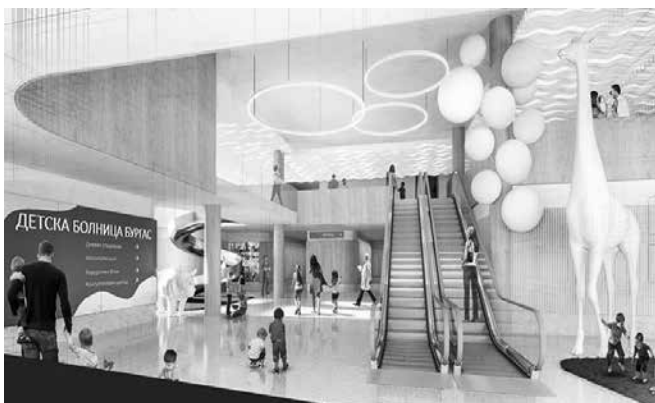
Проектът на бъдещата детска болница