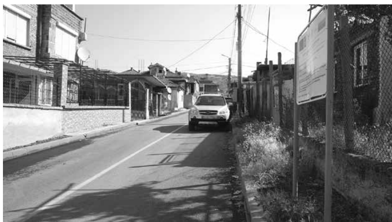
ул. „Зюмбюл“, гр. Айтос

дане на бетонови бордюри и осигуряване на достъпна среда, включително подобряване на достъпа на хора с увреждания.