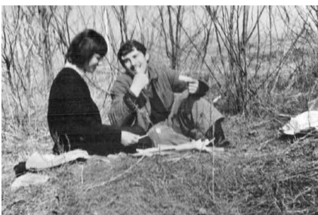
През 1965 г. със съученик на пикник по време на бригада