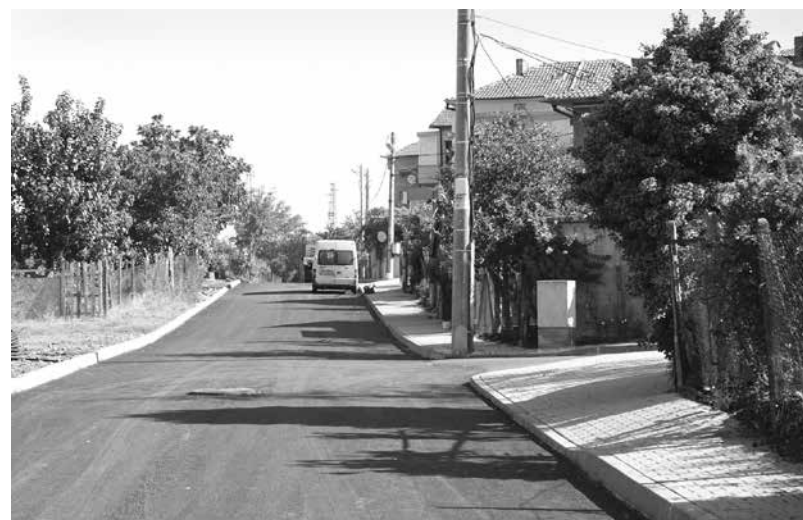
ул. „Христо Кърджолов“, гр. Айтос