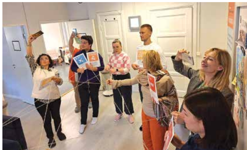
Курсът развива уменията на учителите да проектират и използват учебната среда