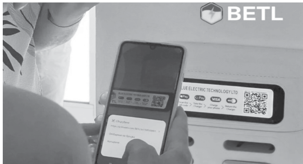
Транзакциите се генерират в криптовалута

„Трябваше да се включа в Телеграм група и всяка вечер след 19:00 часа да харесвам съобщения на профили, които всъщност бяха роботи. Давам ти допълнителни точки, ако