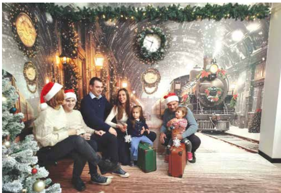
Не ви трябва да ходите в чужбина, за да усетите викториански стил и да съхраните спомени

„Гара Невъзможна“ е коледна фотозона с добавена реалност – място, където гостите на музея, сами или с помощта на музейните екскурзоводи, могат да се снимат и да създадат незабравими празнични индивидуални и семейни спомени. Създадена с изключително внимание към детайлите, тази инсталация ще ви потопи във вълшебна атмос-