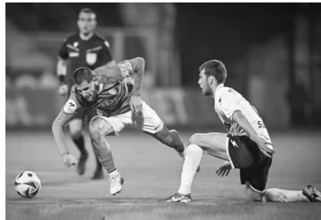
Варненците от „Спартак“ ще са най-сериозният съперник от 8-те контроли на бургазлии