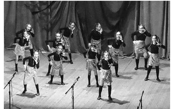
Талантливи млади танцьори на НЧ „Васил Левски 1869“

Както всяка година, в града са поставени кутии за дарения. Съпричастни