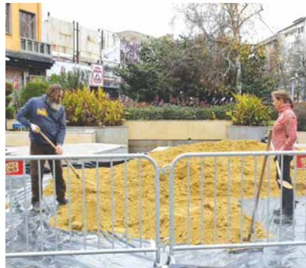
10 тона пясък ще бъдат използвани за пясъчното Рождество

Инициативата се осъществява с подкрепата на Община Бургас.