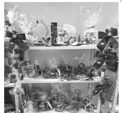
Чудесен Колебен базар и в ДГ „Пролет“

23.12.2024 г., 18.00 часа – Колебно-новогодишна празнична програма в НЧ „Петър Житаров-1928“ с. Караново. В седмицата от 18 до 22 декември 2024 г. очаквайте – Годишни награди за спорт 2024 г. „Спортист и Треньор на 2024 година!“