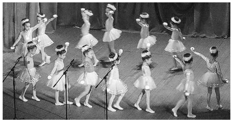
Тази година и детските градини бяха в програмата на благотворителния концерт