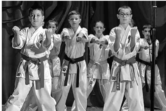
И спортните клубове се включват в благотворителните инициативи

Вече традиционен за Айтос е Благотворителният турнир по волейбол в Спортна зала „Аетос“. Тази година надпреварата ще е на 21 декември, от 10.30 часа. Кореспондирач с инициативата на Бъди