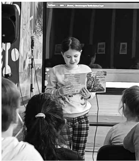
Учениците с интерес прочетоха нейни стихове