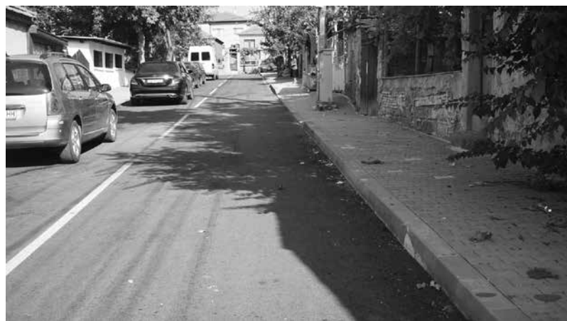
ул. „Даме Груев“, гр. Айтос