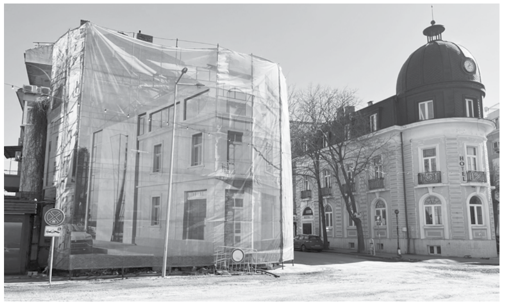
Маймурковата къща и намиращата се в съседство някогашната сграда на БНБ

Можем да потърсим аналогичен пример за строителство на сграда в новата градска история