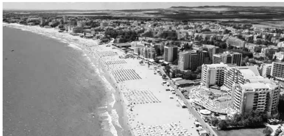
Имотите в Слънчев бряг и Несебър са по-евтини от тези в Созопол