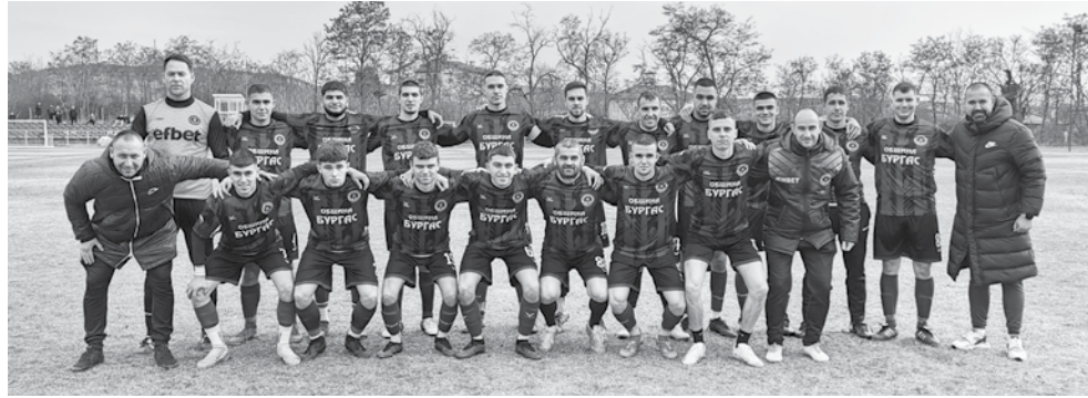
Българовци нанизаха 7 гола във вратата на последния в класирането „Аполония“ (Созопол)

за 7 май – тази между „Русокастро Зк“ и „Бургас спорт“.