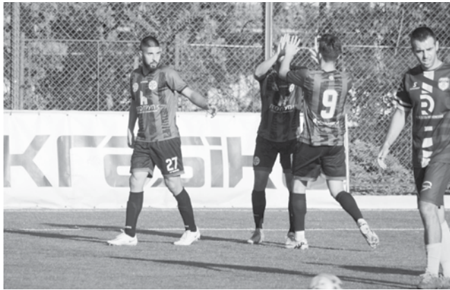
„Нефтохимик 1962“ (вляво) спечели служебно срещу „Вихър“ (Айтос), който съобщи, че няма да се яви за мача