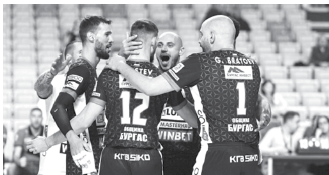
Бургаските отбори „Нефтохимик 2010“ (на снимката горе) и „Дея спорт“ (долу) показват колебливи игри напоследък

Цената е 2 лева на час, а наемането става чрез мобилното приложение Burgas Vikes. Велосипедите трябва да се връщат само на определените площадки, които са отбелязани в приложението. То също така предоставя карта с наличните велосипеди и опция за резервация и плащане.