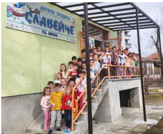
Децата на ДГ „Славейче“ в юбилейната година

Детството е магия, един вълнуващ свят, озарен от звънките детски гласчета,