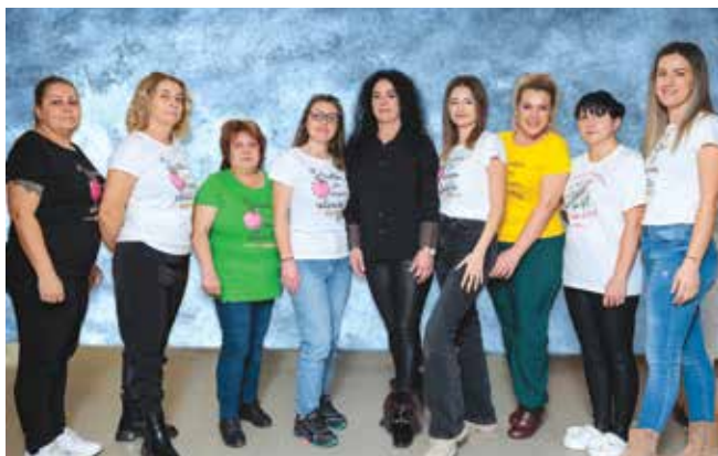
Педагогическият колектив на ДГ „Славейче“ – 2025 г.

За нас щастието на децата е свещено, а успехите им – наша мисия!