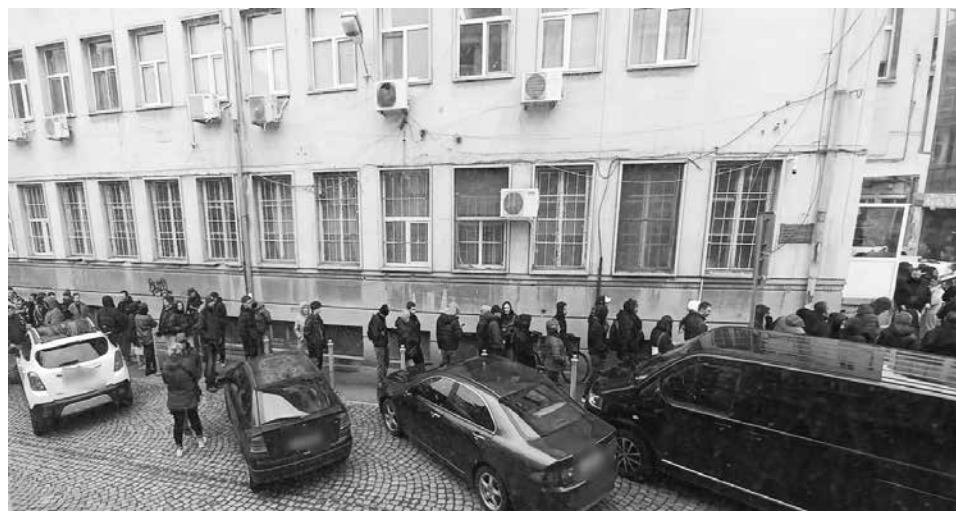
Пред Първо районно управление – Бургас опашките от украинци са факт

мяваме, че на територията на ОДМВР – Бургас, украинските граждани, притежаващи регистрационни карти за временна закрила, валидни до 04.03.2025 г. могат да поискат угължаване на срока им до 30.04.2025 г. в действащите пунктове на територията на Бургаска област – пунктовете са разполо-