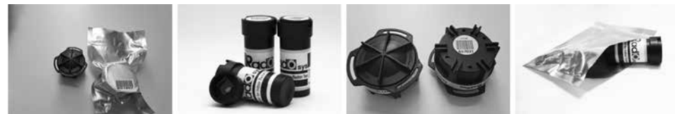
Детектори за пасивно измерване на радон