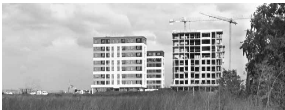
Нивите около Пети километър постепенно се превръщат в жилищни зони

Така освен хората, които купуват жилища с цел да живеят постоянно в тях, в разговора се откриха още три вида купувачи, което донякъде обяснява бурното строителство в Бургас и феноменът население да не расте. Това са: хора, които инвестират, с цел препродажба; хора, които инвестират с цел отдаване под наем; хора, които си купуват за собствени нужди, но за непостоянно живеене в тях.