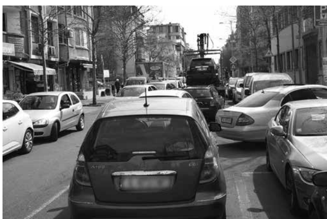
Паркоместото или гаражът са все по-необходими при сделките заради липсата на места в града

„Аз бих казал на тези, които не работят с нас, че не е добра идея за тях. Да, те не правят отстъпки, продават на цените, които са пожелали, но губят връзката с нас, а ние имаме връзка с купувачи, развити маркетингови отдели, с българи в чужбина. Вече е възможно купуването скредит в строеж, което е страхотна новина. Една от банките предлага такава възможност“, заяви Христов.