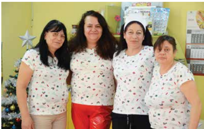
Честит юбилей и на екипа на филиала на ДГ „Славейче“ в село Пирне

С радост Ви каним да бъдете част от незабравима инициатива и да добавите своя отпечатък в историята на детска градина „Славейче“