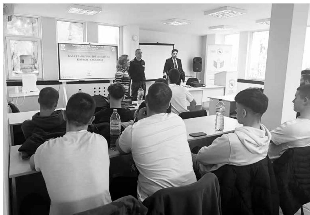
Инициативата е част от дългосрочната стратегия за насърчаване интереса на младите хора към професиите, свързани с националната сигурност

Инициативата е част от дългосрочната стратегия за насърчаване на интереса на младите хора към професиите, свързани с националната сигурност, и ще продължи с редица срещи и практически демонстрации в различни училища в региона.