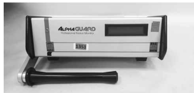
Детектори за директни измервания на радон