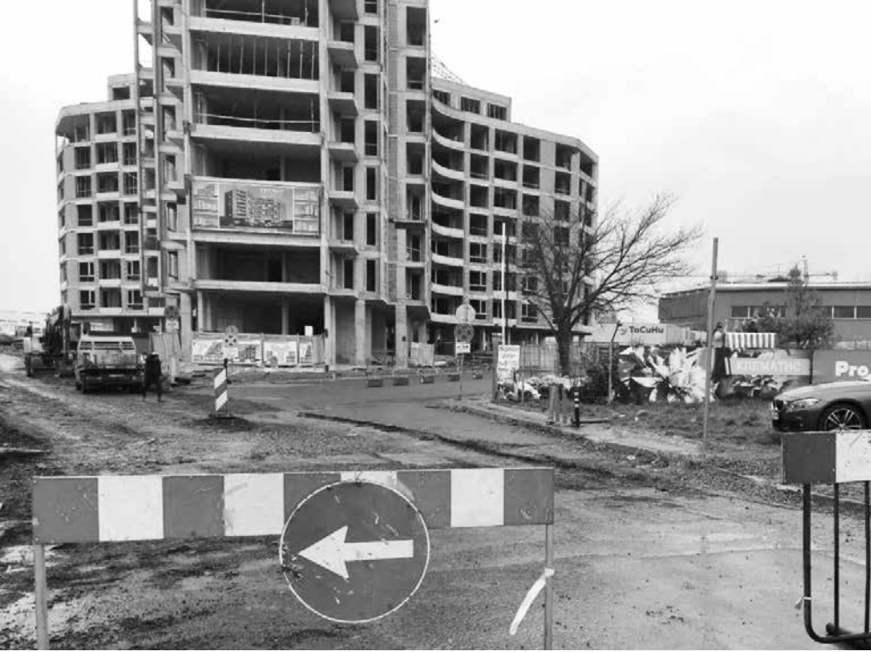
Новият квартал „Магика“ вече се пълни с млади семейства

Първенци. Бургас е сред лидерите в страната по най-много започнати и завършени нови сгради