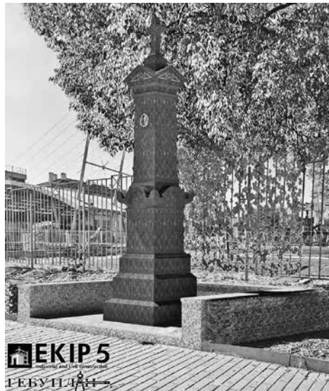
Така ще изглежда бъдещият надгробен паметник на Бащата на Бургас

13-годишна сага. Предложението за такъв е от вече далечната 2012-а