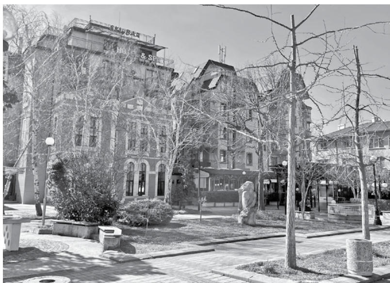
Сградата на бившата Народна милиция (Вляво) е влята в основното тяло на хотел „Сейнт Джордж“ в ЦГЧ на Поморие

Защото групата на ПП ГЕРБ застана зад един проект, който ще даде новата визия на центъра на града ни и неговото развитие. Отново казвам, докладната е отхвърлена, но решението от 2021 г. е в сила. Администрацията работи по законите на Република България. Дадох им срок да внесат ново предложение. Ако не го направят, ще изпълним решението от предходни години.