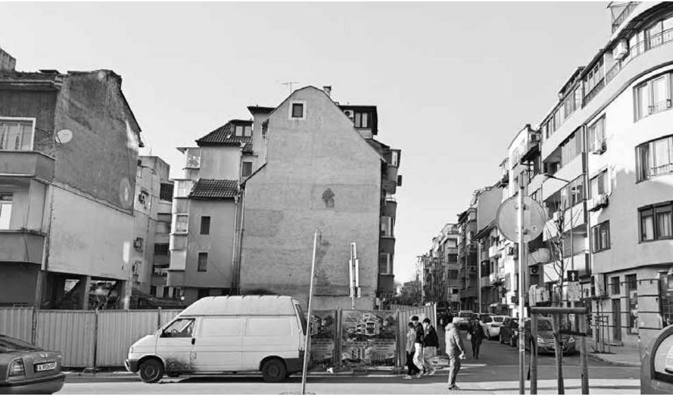
Най-голям процент от сделките са на зелено при започнато строителство