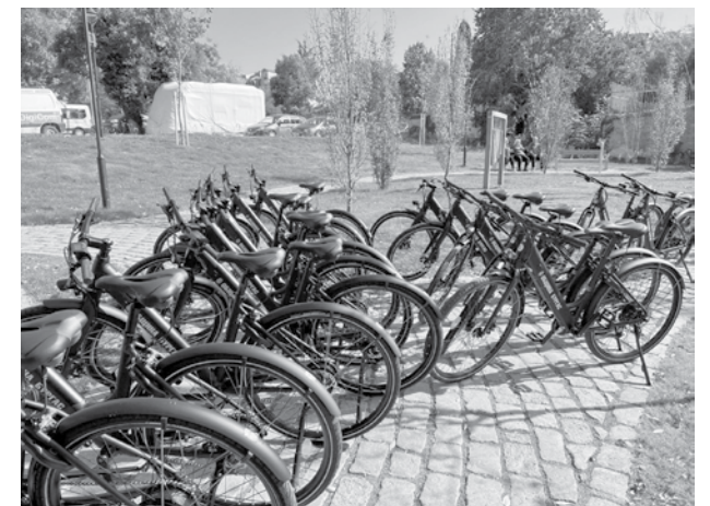
Таксата е 2 лева за час