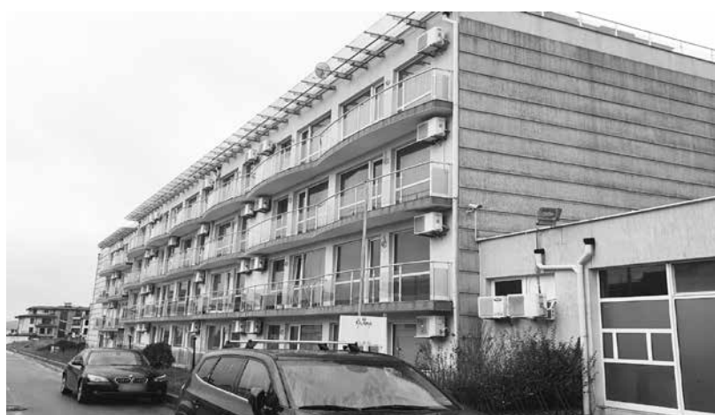
Цените в бургаския Бевърли Хилс – „Сарафеново“, експлодираха през последните години