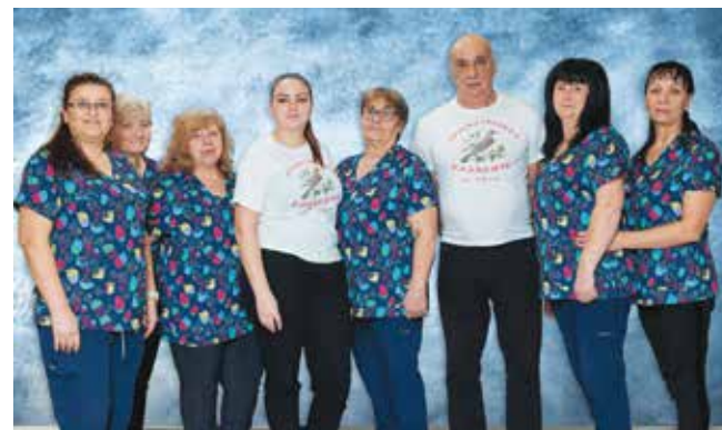
Заедно, с грижа за децата – служителите в детското заведение