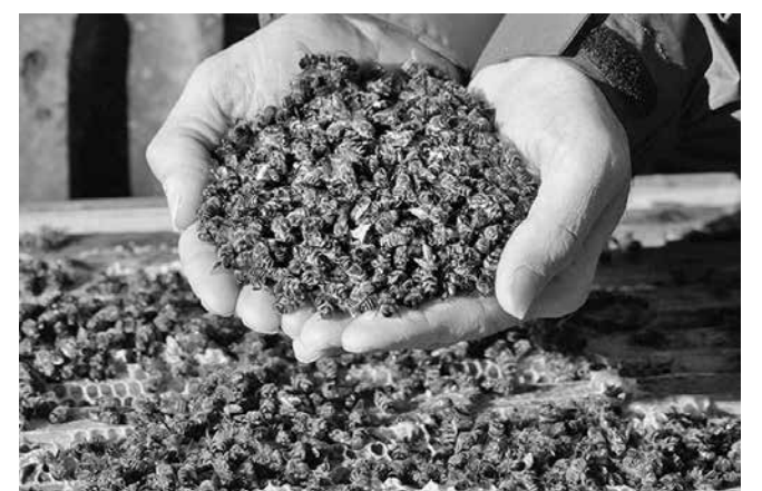
Със сериозна смъртност на пчелните семейства излизат от зимата българските пчелари

Като основна причина за това да не се харчи родният мед е вносният, който влиза на ниска цена от други държави.