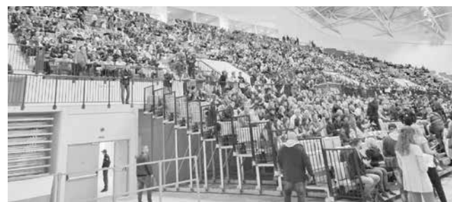
По-често до момента залата се ползва за културни събития, но и там има какво да се желае по отношение на техниката

Изникват въпроси защо толкова се забавят дейностите по пълното оборудване на „Арена Бургас“, още повече, че и в предишни обществени поръчки бяха включвани подобни инвестиции с цел оборудване.