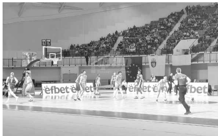
Въпреки че първото спортно събитие бе баскетболен мач, със сегашната поръчка ще се закупува оборудване за волейбол и баскетбол