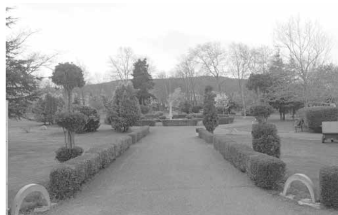
Обзор се готви за летния туристически сезон