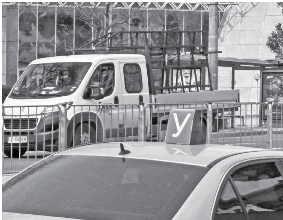
Към момента полигони не се включват в програмите за шофьорски курсове, курсистите паркират в междублокови пространства

Според него, наличието на подходящи условия за тренировки е ключово за обучението на младите шофьори, но използването на полигони за изпити не е оптимално решение.