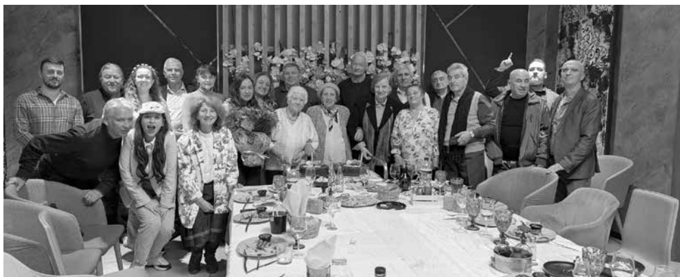
Снимка за спомен от деведесетия рожден ден