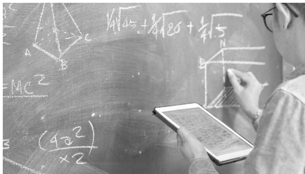
По-голяма част от децата опират до частните уроци или курсовете за подготовка