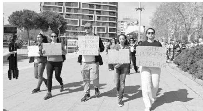
„Те не могат да говорят, а ти защо мълчиш?!“, „Насилието над животни е престъпление“, бе изписано на плакатите