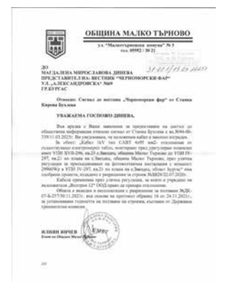
Отговор от общината