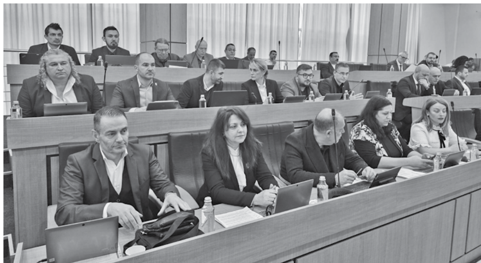
От групата на ГЕРБ в местния парламент браниха със зъби и нокти докладната в спор с част от опозицията

В края на дебатите думата взе кметът Димитър