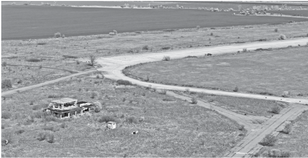
Намерението на общината е отново да получи терените на военното летище в Равнец, за да привлече инвеститори

Възможност. Терените са удобни за тестване на дронове и бъдещето на въздушната сигурност