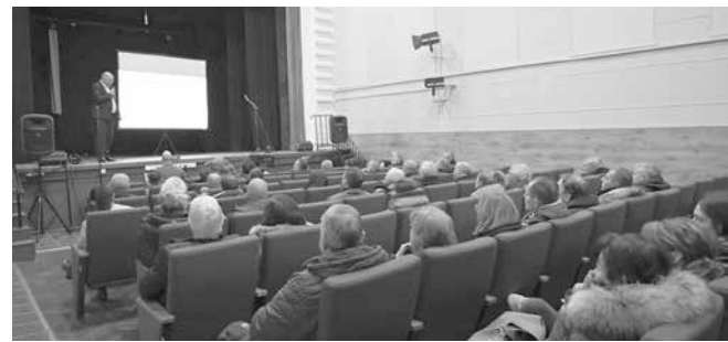
В средата на месец януари бе проведено обсъждане с гражданите за посочността на улиците в Квартала на Поморие