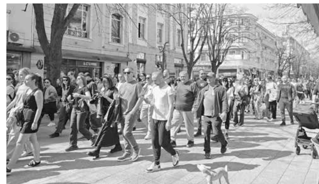
Протестът ще се проведе в събота, от 11:00 часа пред Съдебната палата в Бургас

„Гражданите на Бургас излизаме в подкрепа на животните, които несправед-