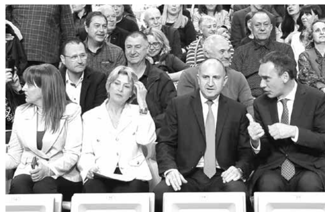
Преди 2 години бе официалното откриване на залата, но още тогава се видя, че има довършителни работи по нея