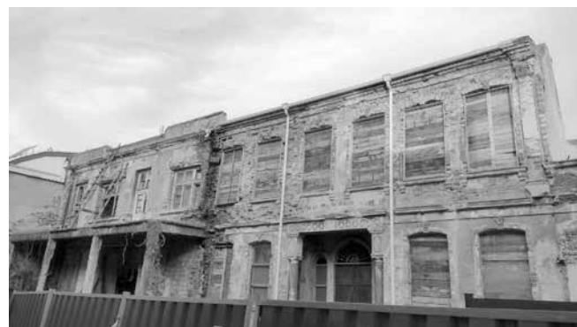
Община Бургас предприе спешни мерки за обезопасяването на рушащата се сграда в центъра на града

Колкото и да е трудно да се види в момента, но сградата е истинско произведение на изкуството. Вътре има изключително ценни мозайки, а таваните са рисувани от италиански