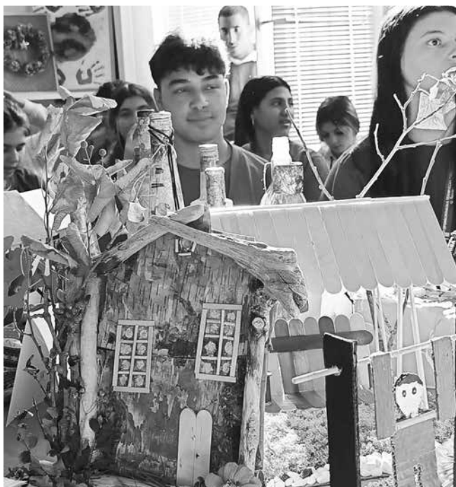
Къщичката – пано на 12 В клас

Специалната награда на журито отиде при бижутата от кора на портокал на 11А клас. След показаното всички в ПТГ са убедени, че рециклирането и креативността вървят ръка за ръка.