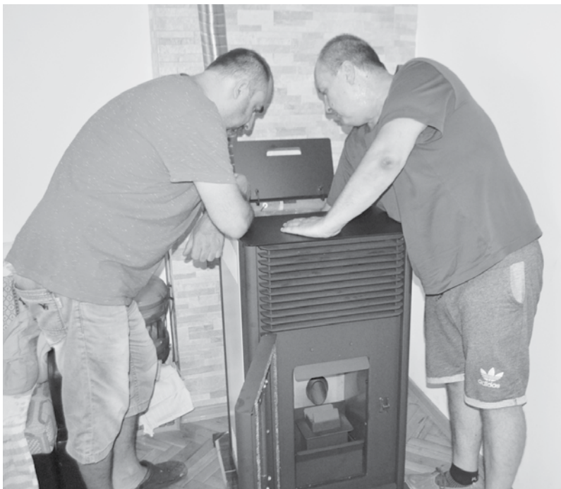
Над 5500 са до момента новите уреди доставени в над 4200 домакинства

Постижение. Проектите за подмяна на старите отоплителни уреди са в основата на добрите резултати