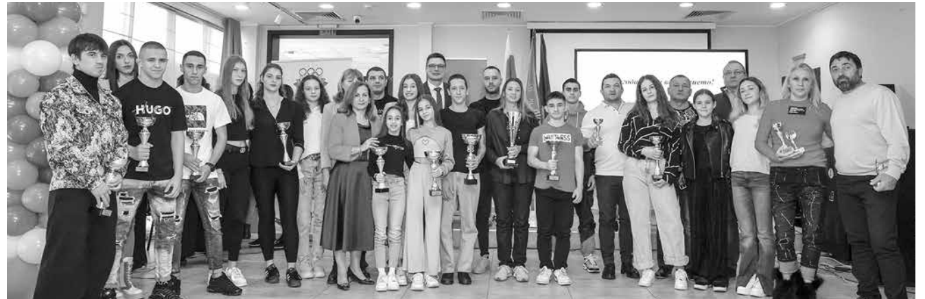
Традиционният „Бал на спортиста“ – постигнатите победи са правопрпорционални на вложените усилия

„По никакъв начин не съм се опитал да влияя на колегите си да ме защитават. Те сами решиха и направиха подписката, за което им благодаря. Моята работа говори сама за себе си“, коментира в началото на седмицата пред наш репортер Стойчев. Що се отнася до интригите, доносите и номерата, той бе категоричен: „Публична тайна са