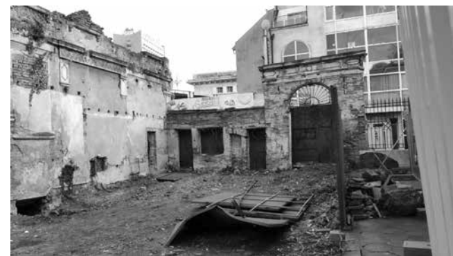
Къщата е една от най-старите жилищно-търговски сгради в Бургас

Именно тя е била избрана да приюти цар Фердинанд при неговото посещение в Бургас. В годините са правени няколко преустройства, като последното е от около 1930 година.