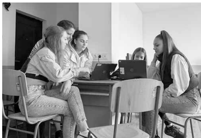
В Спортното се предлага адаптиран учебен режим, съобразен с двузачовите тренировки на учениците