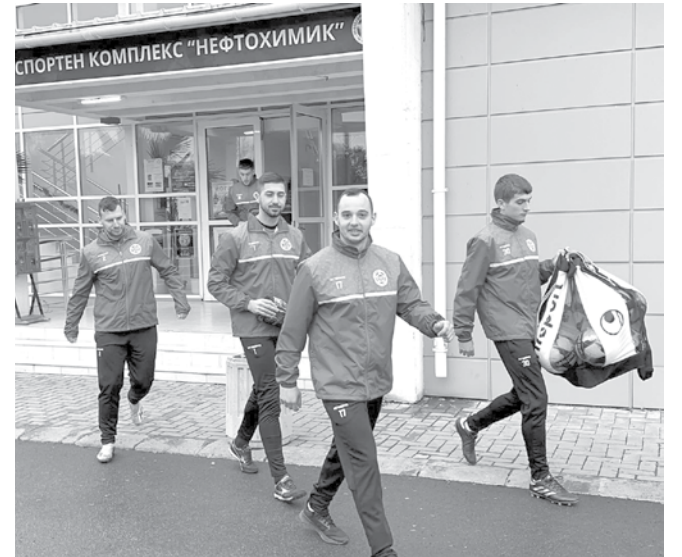
Първата сериозна проверка за бургазлии е срещу дублиращия отбор на „Черно море“

В началото на февруари предстоят две по-сериозни проверки: на 7