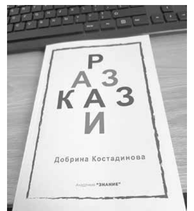
На егун гъх четене...

23 януари, 19:30 часа, Домна киното – София Академия "Знание" с ПЪРВА ПРЕМИЕРА за 2025 г.