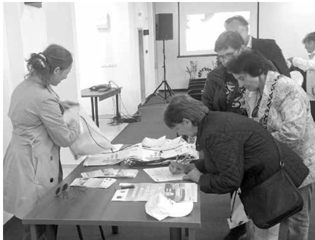
В Несебър също интересът е голям към тяхната екологична програма

Проектът е на стойност над 9 милиона лева и ще се реализира на етапи през следващите четири години. Той ще допринесе за намаляване на замърсяването с фини