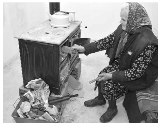
Старите печки на дърва и въглища са един от основните замърсители с фини прахови частици

Това постижение е от съществено значение, тъй като ефектът върху чистотата на въздуха е забележим особено в зимните