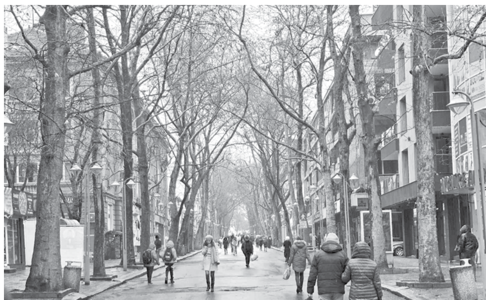
Подмяна на растителността започна в горната част на „Александровска“

Дейностите ще бъдат изпълнени в съответствие с Техническата спецификация, одобрена от Община Бургас, и изискванията на „Препоръки за зелени мерки в градска среда“, публикувани на официалния