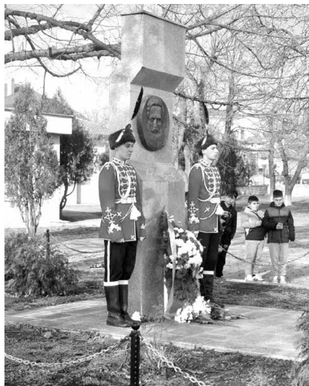
Гвардейците на почетна стража