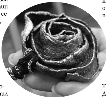
Атрактивното бижу от кора на портокал