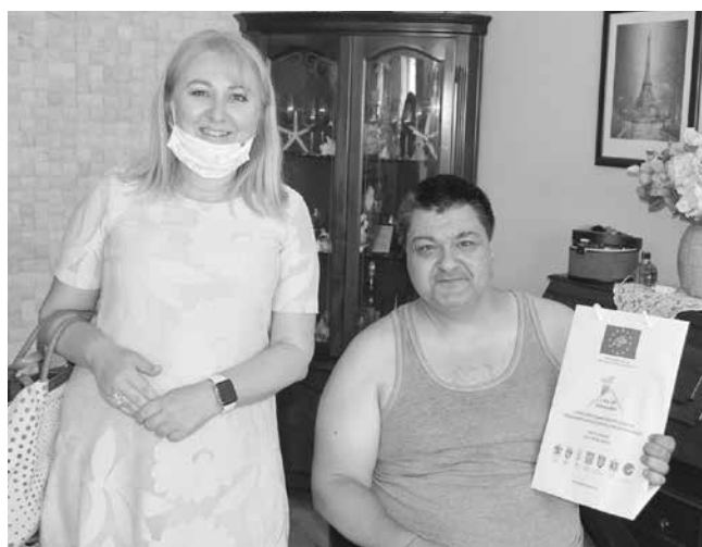
Няколко са проектите, по които Община Бургас подменя старите отоплителни уреди с нови

Общата стойност на проекта възлиза на 6 153 142 лв., инвестирани в доставка, монтаж и въвеждане в експлоатация на новите екологични уреди.