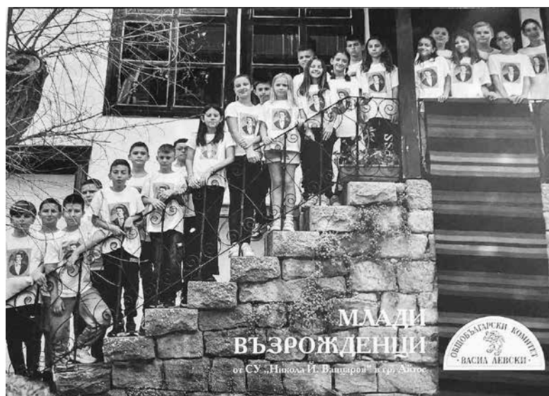
Деца на Айтос