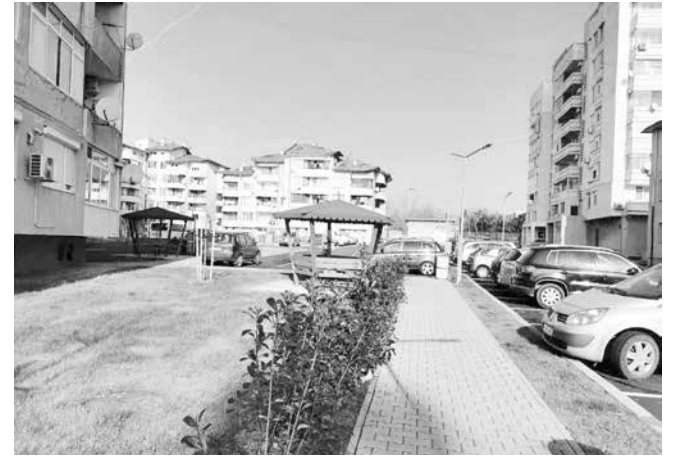
По проекта за устойчива градска мобилност Общината подготвя Генерален план за организация на движението 2025 На снимката: нови паркинги в градския кв.49