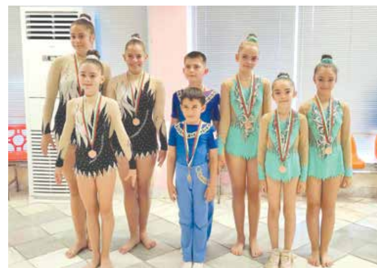
Снимка с медалите