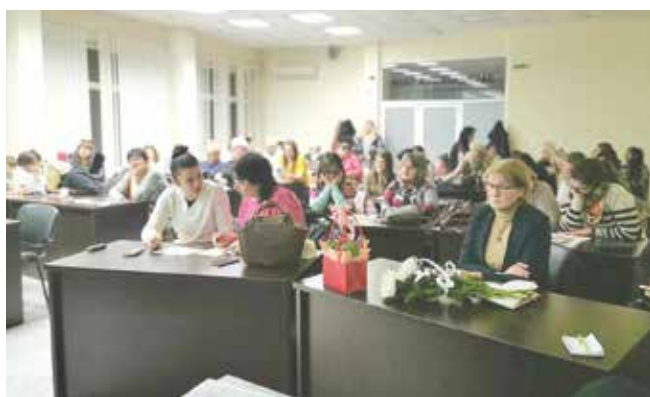
Срещата преля в приятелска емоционално-дигитална забава