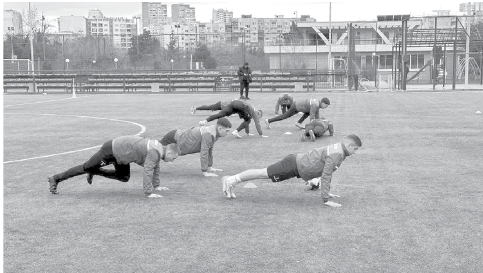
Подготовката на „Нефтохимик 1962“ ще се проведе изцяло на клубната база в комплекс „Изгрев“

Подготовката на „Нефтохимик 1962“ ще се проведе изцяло на клубната база в комплекс „Изгрев“. Първата кон-