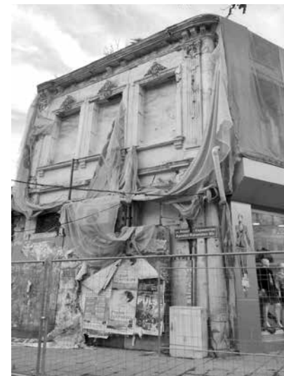
Много от собствениците на красивата, но силно занемарена къща живеят в чужбина и комуникацията с тях е изключително трудна