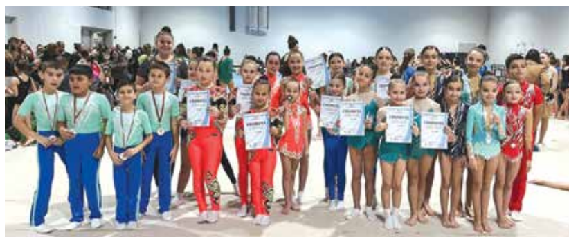
„Ангелите“ изпратиха година с много участия, с много медала и призове

Затворихме още една глава от историята на нашия спортен клуб – година, изпълнена с предизвикателства, усилия, победи и незабравими моменти. Изключително успешна се оказа състезателната 2024 година за спортистите от клуба по спортна акробатика „Ейнджълс“ – гр. Айтос. Акробатите много бързо се наложиха на квадрата и доказаха, че са таланти и можещи деца. През 2024 г. „Ангелите на Айтос“ завоюваха 18 златни, 10 сребърни и 13 бронзови медала. Отборът има и 33 призови класирания до 8 място. От гържавни и общински турнири – 13 златни, 7 сребърни и 9 бронзови медала, от международни турнири – 5 златни, 3 сребърни и 4 бронзови медала