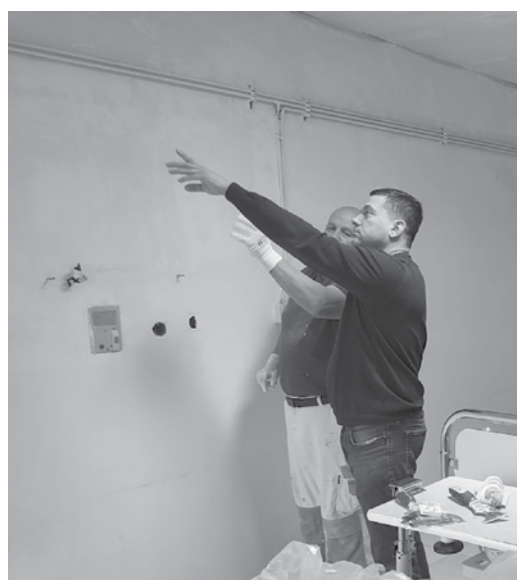
Добрният пример заразява и в каузата се включват не само приятели и близки, а и непознати хора