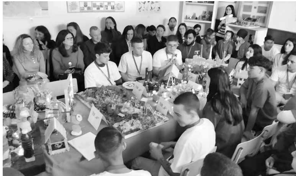
На голяма подкрепа от своите съученици се развиха отборите при представянето на проектите