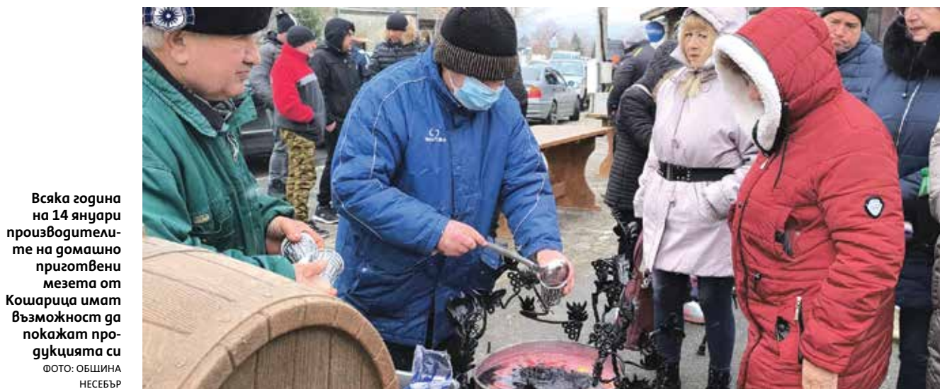
Всяка година на 14 януари производителите на домашно приготвени мезета от Кошарица имат възможност да покажат продукцията си

В музикално-танцовалната програма на четиринадесетото издание на Празника на домашната нагеница участваха самодейните състави към читалище „Светлина - 1928“ и група „Морски бриз“ към пенсионерски клуб в Новия Несебър.