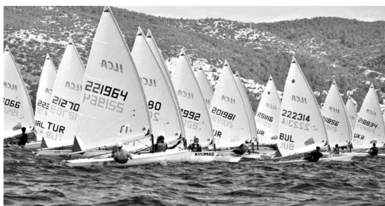
Организирано от Vodrum Spor Yelken, събитието приветства 118 ветроходци от 10 европейски държави

Калудов коментира, че е сигурен, че в ръцете на двамата спортът в Бургас има ярко бъдеще.