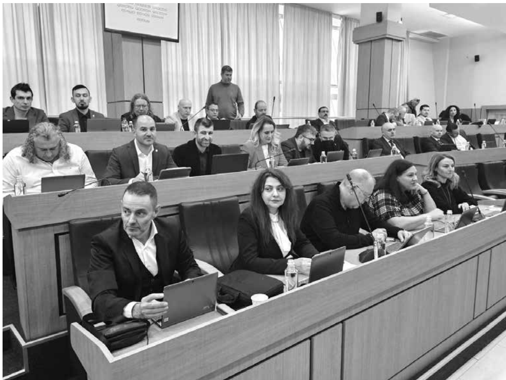
Бургас подкрепи единодушно кандидатурата на града

Подготовка. Специална фондация ще се занимава с кандидатурата на града