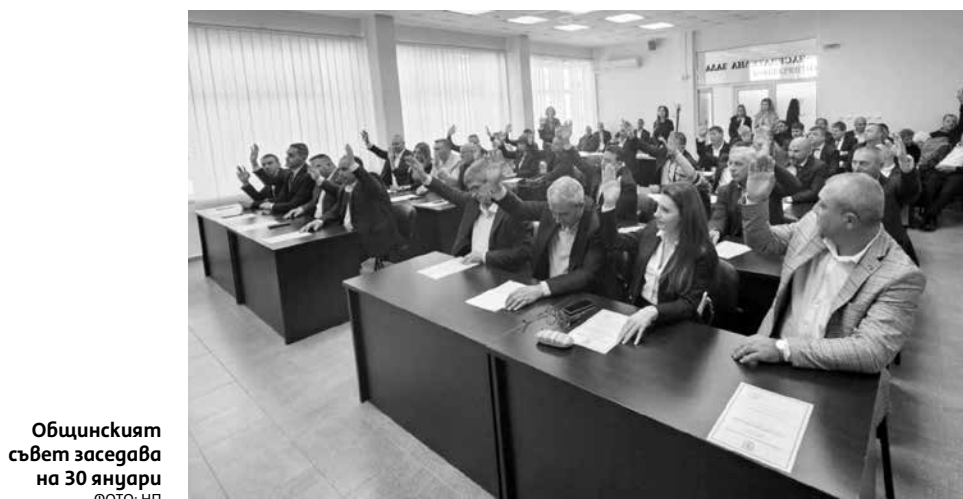
Общинският съвет заседава на 30 януари

Схемите за поставяне на преместваеми обекти върху общински имоти са