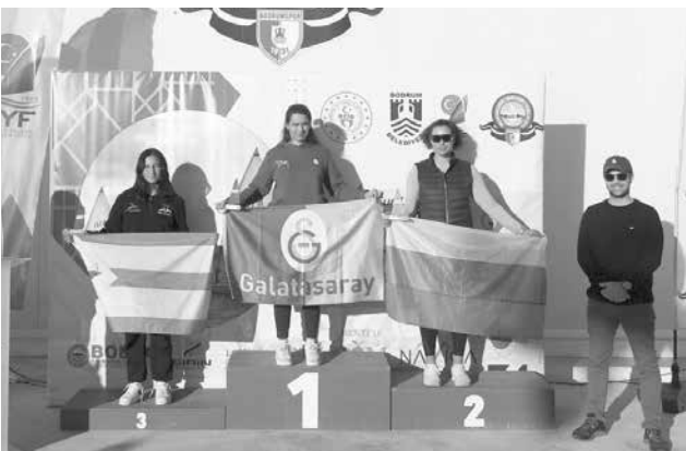
Бургазликата спечели сребърния трофей от Европейската купа по ветроходство в клас ILCA 6

„Организирано от Vodrum Spor Yelken, събитието приветства 118 ветрохо-