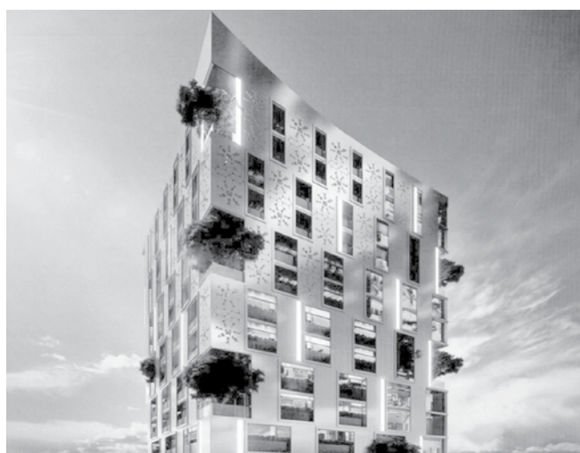
На Комисията по устройство на територията не хареса визуализацията, представена от инвеститорите

„Ще кажа само, че ролята на Общинския съвет е да защитава инвеститора и гражданите по най-добрия начин със силите, които му позволява законът. Предложението само по себе си е законосъобразно и няма пречка да бъде гледано от Общински съвет. Дали той преценява по целесъобразност е друга тема на разговор. Няколко пъти чул подробен устройствен план (ПУП). С това предложение не се предлага промяна в него, а само завишаване на показателите. Донякъде разбирам всички изказани аргументи, затова ще се въздържа до сесията от гласуване“, каза той.