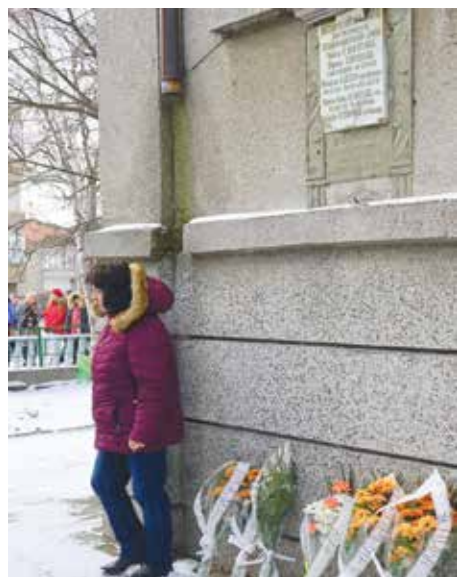
Пред паметната плоча, в памет на ратниците от освободителната епоха

Организатори: Община Айтос, Църковно настоятелство на храм „Св. Димитър“, СУ „Никола Йонков Вапцаров“ Място: Параклис-костница