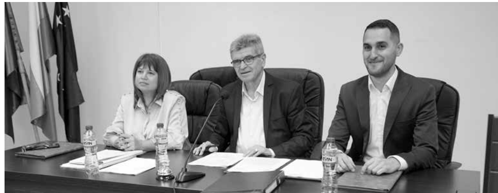
Председателството на Общински съвет – Айтос

Според разпоредбите, превакутирането от левове в евро се извършва, като числовата стойност в левове се разделя на пълната числова стойност на официалния валутен курс, изразен с шест цифри. След превакутиране получената сума се закръглява до втория знак след десетичната запетая. След датата на въвеждане на еврото в България посочените размери на цените в лева трябва да се превакутират автоматично в евро. Законът за въвеждане на еврото поставя изискването за