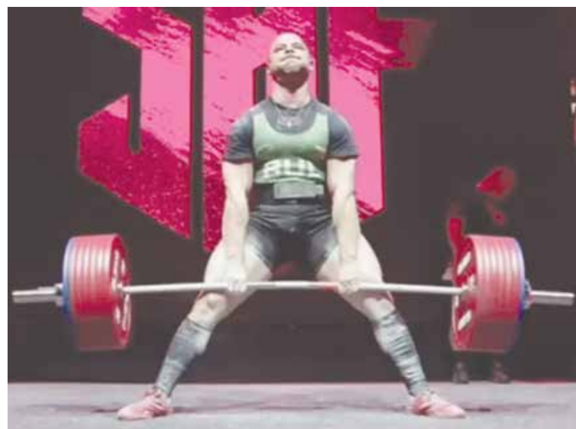
Да счупиш световния рекорд в най-силовия спорт

И двата ми харесват, но силовият трибой надделява...“, признава през 2019 г., пред НП Кръстев. Активно се заел със силовия трибой от януари 2018 г., та до днес. За това време напредвал силовото много бързо и целта му сега е много по-висока – световният рекорд.