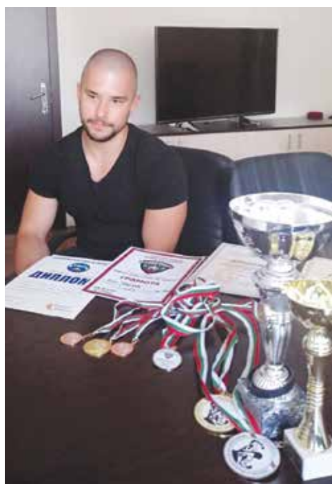
С наградите, купите и медалите – 2019 г.