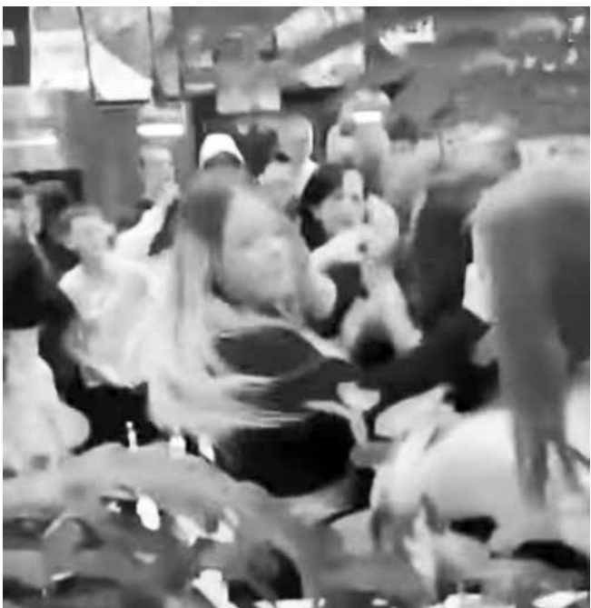
Бой на ученички в бургаски мол