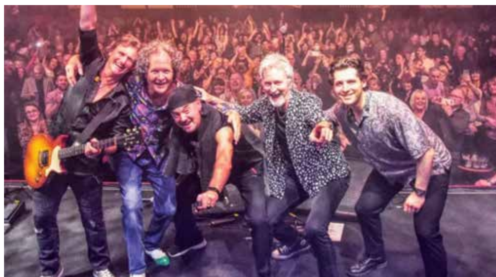
Групата е издала досега 26 албума

Групата, която скоро ще отпразнува своята 60-а годишнина, е издала 26 албума, повече от 30 сингъла и е продала над 30 милиона копия от своите записи. Smokie са спечелили множество златни и платинени сертификати. Над десетина песни на Smokie отдавна са се пре-