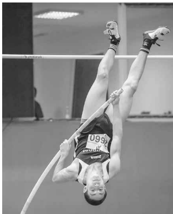
Овчарският скок бе една от дисциплините, в които младият атлет доминира

Младият атлет доминира в четири от дисциплините – 60 метра, 60 метра спренигствия, 1000 метра и овчарски скок. Специалистите подчертават, че силното му представяне в овчарския скок носи почерка на легендарния треньор Величко Денчев, с когото Райков работи в продължение на четири години. Големият наставник ни напусна през миналата година, но остави траен отпечатък върху