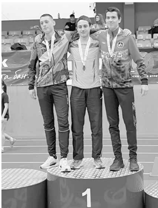
Бургазлията записа 4639 точки