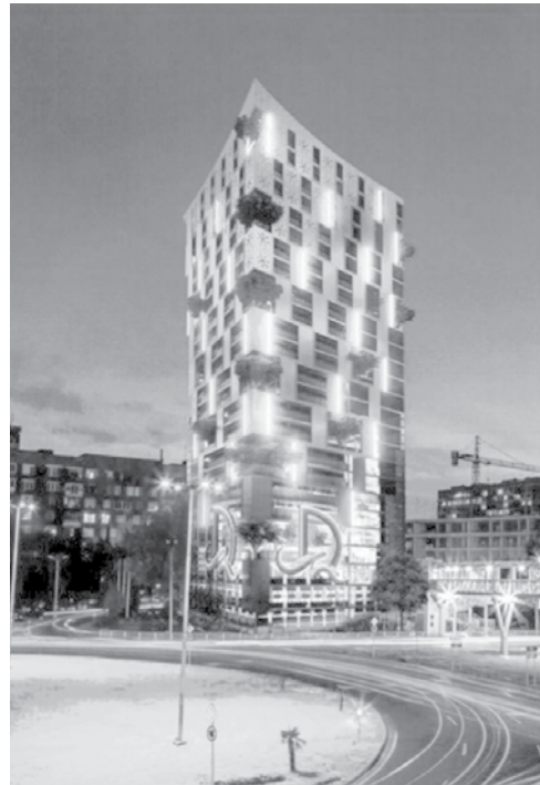
Братя Диневи искат да съборят емблематичния хотел (на снимката вляво), а на негово място да издигнат нова по-голяма сграда със същата височина