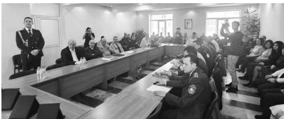
На церемония в сградата на РДПБЗН – Бургас бяха отличени огнеборци от областта в три категории

Наградените ще представят Бургаска област на националния етап на конкурса „Пожарник на годината“.