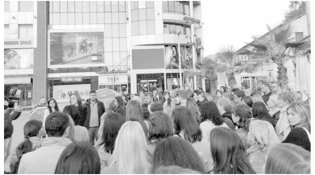
Родители от СУ „Св. св. Кирил и Методий“ преди месеци спряха децата си от училище, протестираха срещу дете, което пречи в клас

Случката е от бургаска гимназия, намираща се на оживена улица. Ядосан от ученик от дванадесети клас изтръгва вратата на тоалетна и я мата през прозореца от третия