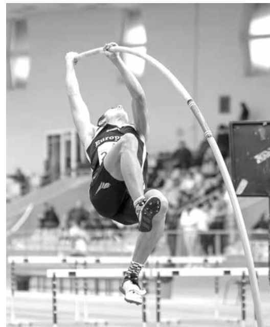
Специалистите подчертават, че силното му представяне в овчарския скок носи почерка на легендарния треньор Величко Денчев, с когото Райков работи в продължение на четири години