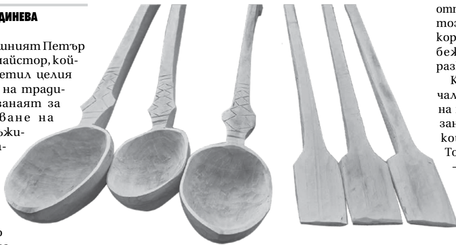
Дървени лъжици, изработени от майстора

На въпроса дали са се правили трудно всички тези дървени приспособления, дядо Петър от-