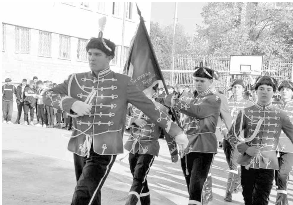
Гвардейците на ПГЕЕ „Константин Фотинов“ са символ на дисциплина и представителност