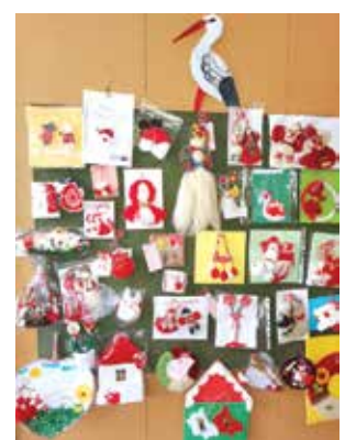
Традиционна е изложбата на мартениците от конкурса

Експонатите не се връщат. Най-добрите модели ще бъдат наградени и експонирани в изложба във фойето на читалището.