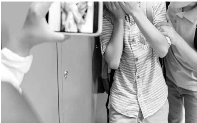
Агресията в училищата и извън тях се увеличава

Със сигурност това не е единственият подобен случай. Според мен вината си е у родителите, които не възпитават децата си в уважение към училището и учителите. В последно време учителите не са авторитет. Първите седем години липсват и на децата, и на родителите“.