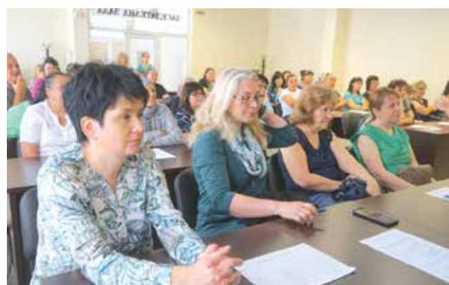
Информационна среща по проекта – 21 юни 2023 г.

Проект BG05SFPR002-2.001-0097-C04 „Грижа в дома в община Айтос“, Процедура BG05SFPR002-2.001 „Грижа в дома“, финансирана от Европейския социален фонд плюс, чрез Програма „Развитие на човешките ресурси 2021-2027“